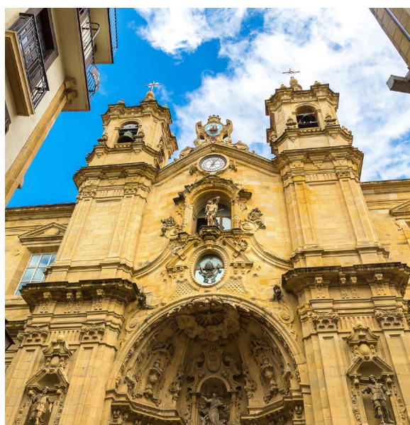
▲ BASILICA DI SANTA MARÍA DEL CORO

Cattedrale del Buen Pastor, il Teatro Victoria Eugenia e il Palazzo Comunale, sede del Gran Casinò fino a quando, nel 1924, il gioco non fu proibito.