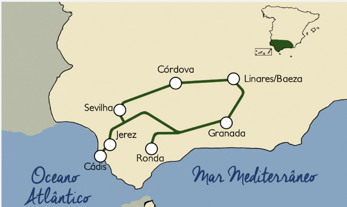
▲ ITINERÁRIO AL ANDALUS