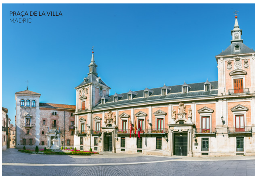
PRAÇA DE LA VILLA MADRID

Apaixona-te por esta cidade cosmopolita, vanguardista e mediterrânica que te irá surpreender a cada instante. Percorre-a a pé ou em bicicleta e descobre os seus bairros, Las Ramblas e a sua marginal. Sente como se estivesses na Idade Média quando mergulhares nas ruelas do seu famoso bairro Gótico . Dá um salto ao Modernismo catalão com Antonio Gaudí: admira a sua impressionante obra-prima, a Sagrada Família , ou o Parque Güell . Conhece a recheada agenda cultural da cidade e vai a exposições, concertos, peças de teatro... Deleita-te com a gastronomia barcelonesa que conjuga tradição e criatividade nos fogões. Permite-te um capricho: prova a pastelaria artesanal e os seus vinhos espumantes. Também podes chegar a Barcelona em AVE desde Málaga.