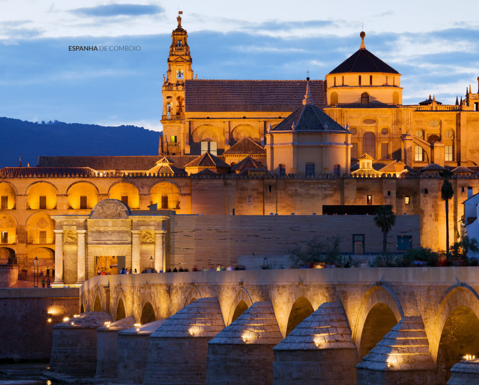
▲ MESQUITA-CATEDRAL CÓRDOVA