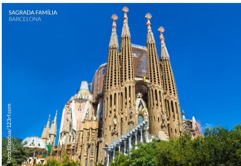
SAGRADA FAMÍLIA BARCELONA