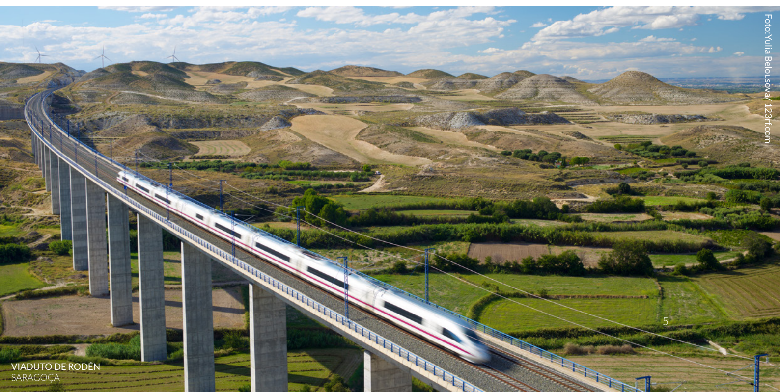
VIADUTO DE RODÉN SARAGOÇA