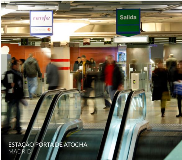
ESTAÇÃO PORTA DE ATOCHA MADRID

Há mais propostas de viagens organizadas de comboio. Estas são apenas algumas.