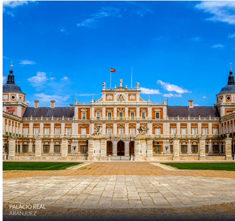
PALÁCIO REAL ARANJUEZ

Há mais propostas de viagens organizadas de comboio. Estas são apenas algumas.