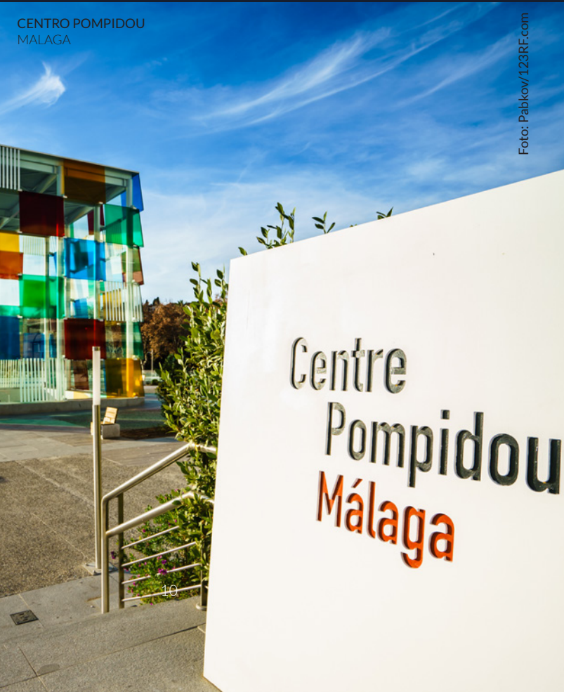
CENTRO POMPIDOU MALAGA

Solo due ore e venti minuti separano Madrid dalla città mediterranea che vide nascere il geniale pittore Pablo Picasso.