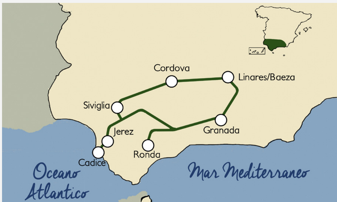
▲ ITINERARIO AL ANDALUS