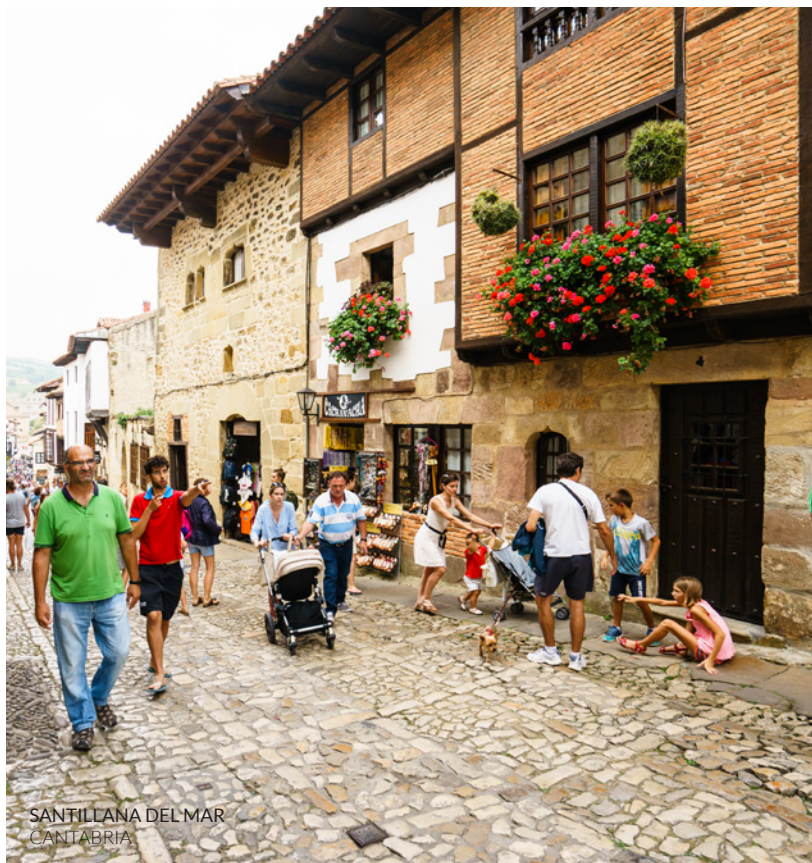
SANTILLANA DEL MAR CANTABRIA

Se sei attratto dalla grandiosa bellezza della cornice cantabrica, tra mare e montagne, scegli il percorso Paradiso Verde , che si snoda tra Bilbao (Paesi Baschi) e Oviedo (Asturie). Conoscerai cittadine medievali come la deliziosa Santillana del Mar (Cantabria) e località marinare come Laredo e Llanes (Asturie). Avrai l'occasione di fare un'escursione in barca per visitare una fabbrica di conserve e scoprire come vengono elaborate le famose acciughe di Santoña (Cantabria). Potrai ammirare la natura imponente del parco nazionale dei Picos de Europa e assaporare il tradizionale sidro asturiano. Oltre alla moderna Bilbao, conoscerai due belle città affacciate sul mar Cantabrico: Santander e Gijón .