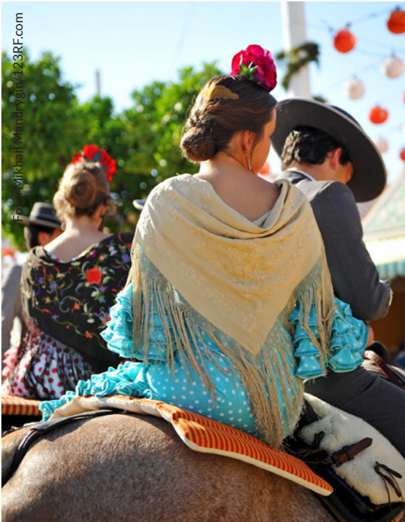
▲ FERIA DE ABRIL SIVIGLIA