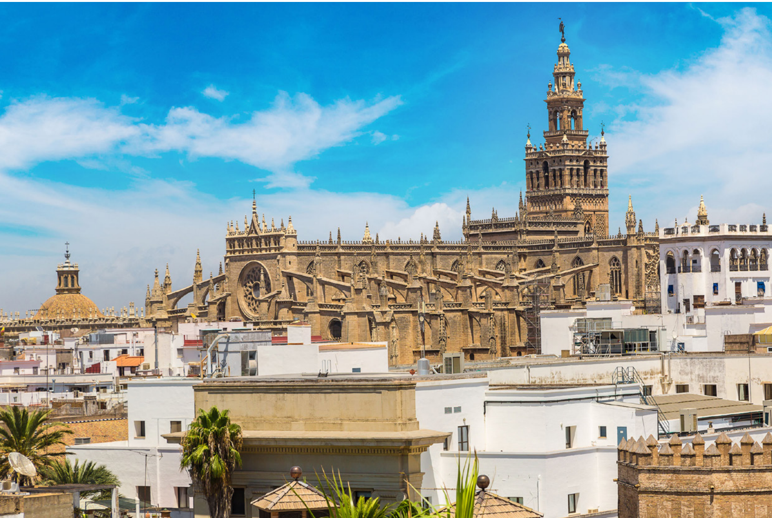
▼ CATTEDRALE DI SANTA MARÍA DE LA SEDE SIVIGLIA

Se ti recherai in occasione della Pasqua o della Feria de Abril , potrai prendere parte ad alcune delle feste popolari più significative del paese.