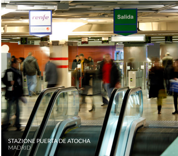
STAZIONE PUERTA DE ATOCHA MADRID

Sono disponibili altre proposte di viaggi organizzati in treno. Queste sono solo alcune.