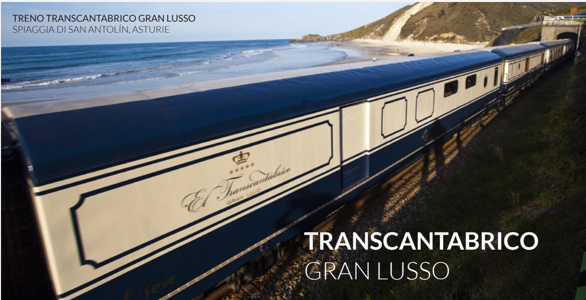
TRENO TRANSCANTABRICO GRAN LUSO SPIAGGIA DI SAN ANTOLÍN, ASTURIE