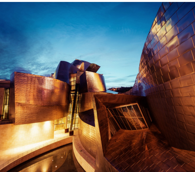
▲ 古根海姆博物馆毕尔巴鄂 (MUSEO GUGGENHEIM BILBAO)