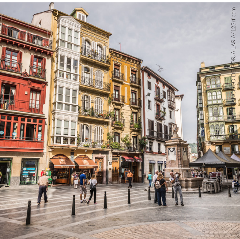
▲ 老城区 (CASCO VIEJO) 毕尔巴鄂