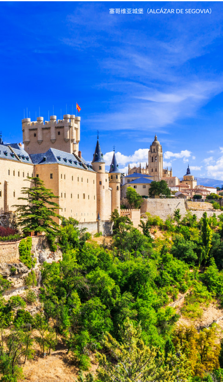
塞哥维亚城堡 (ALCÁZAR DE SEGOVIA)