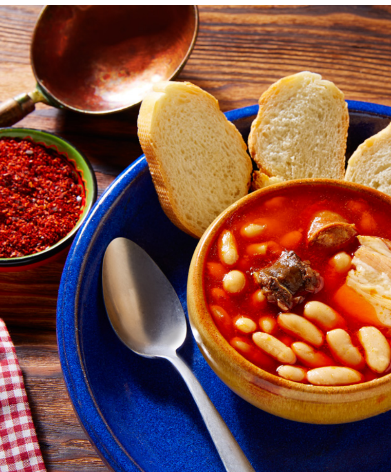
▲ 阿斯图里亚斯炖菜