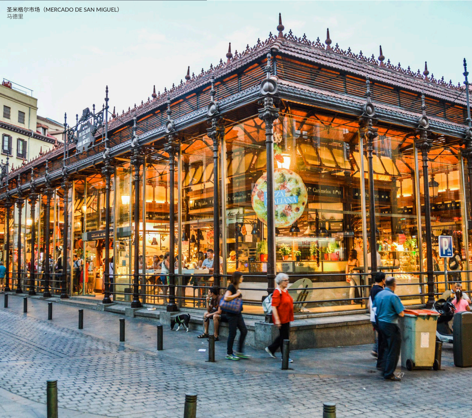
圣米格尔市场（MERCADO DE SAN MIGUEL） 马德里

如果你正在寻找品尝优质西班牙美食的新颖方式，请前往城市市场（mercados urbanos）。这些充满历史意义的地方已经过彻底改造，提供独特的美食体验。马德里的圣米格尔市场（mercado de San Miguel）、巴塞罗那的博盖利亚市场（La Boquería）或瓦伦西亚的中央市场（mercado Central），你可以在那里品尝葡萄酒和美食小吃，聆听现场音乐并融入当地人的生活。简直是视觉和味蕾的双重享受！