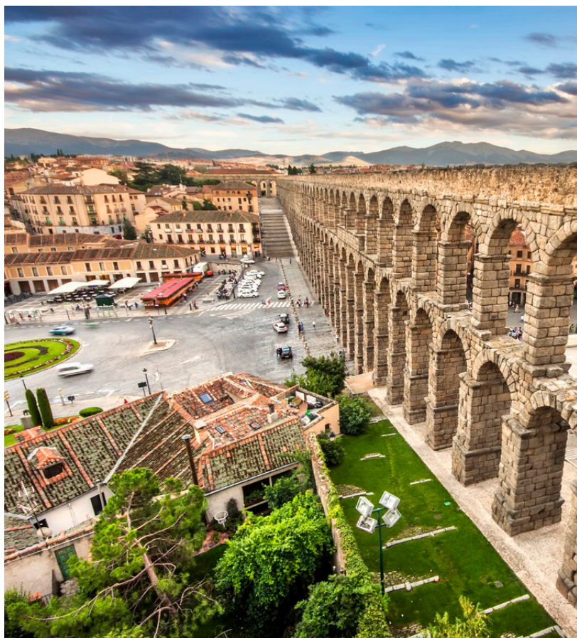
▲ 塞哥维亚的古罗马引水渠（ACUEDUCTO DE SEGOVIA）