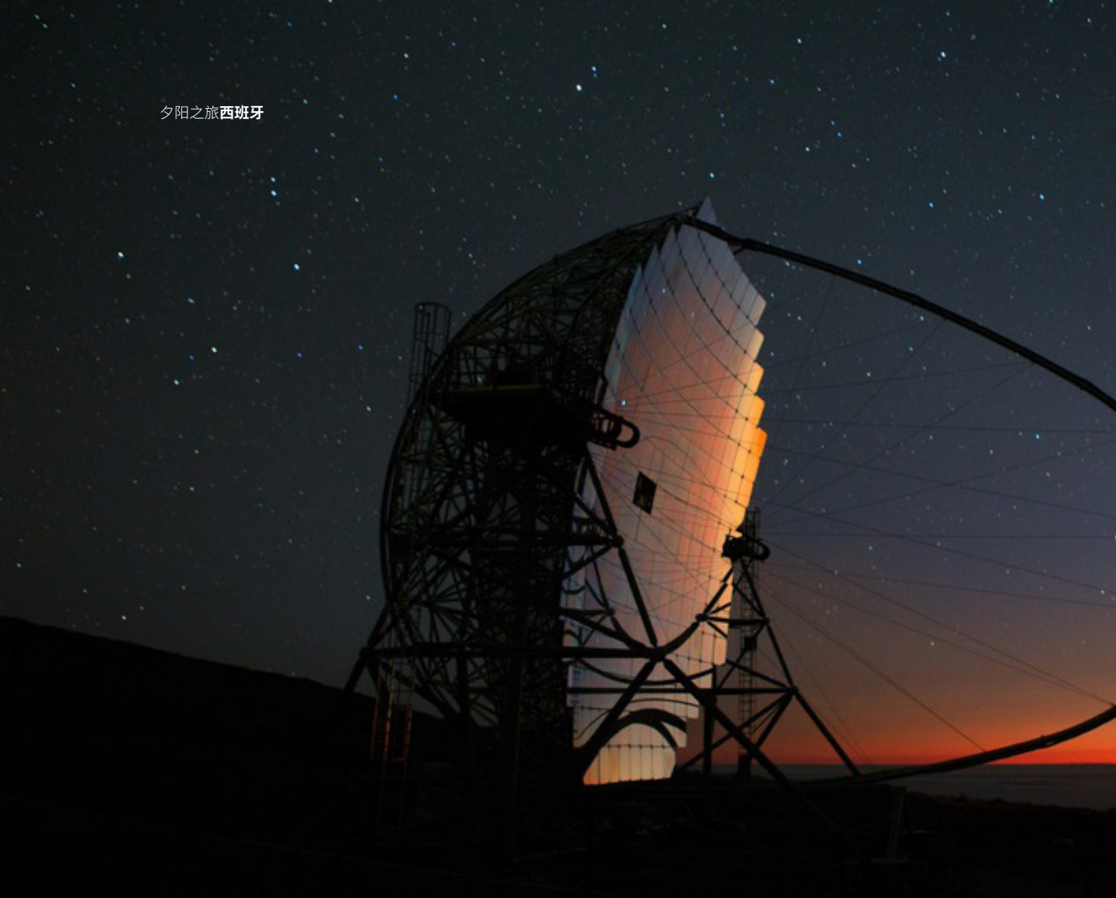
▲ 穆查丘斯罗克天文台 (OBSERVATORIO ASTRONÓMICO INTERNACIONAL DEL ROQUE DE LOS MUCHACHOS) 帕尔玛岛 (LA PALMA)