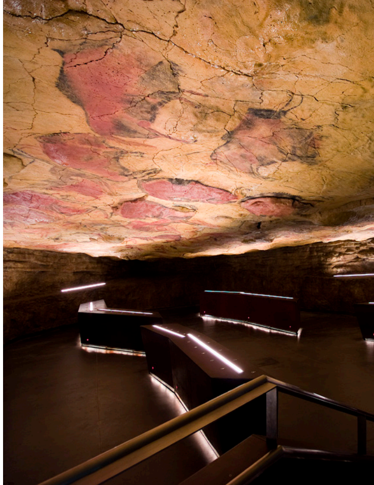
▲ NEOCUEVA-阿尔塔米拉国家博物馆及研究中心 (MUSEO NACIONAL Y CENTRO DE INVESTIGACIÓN DE ALTAMIRA) 海边的散提亚拿，坎塔布里亚