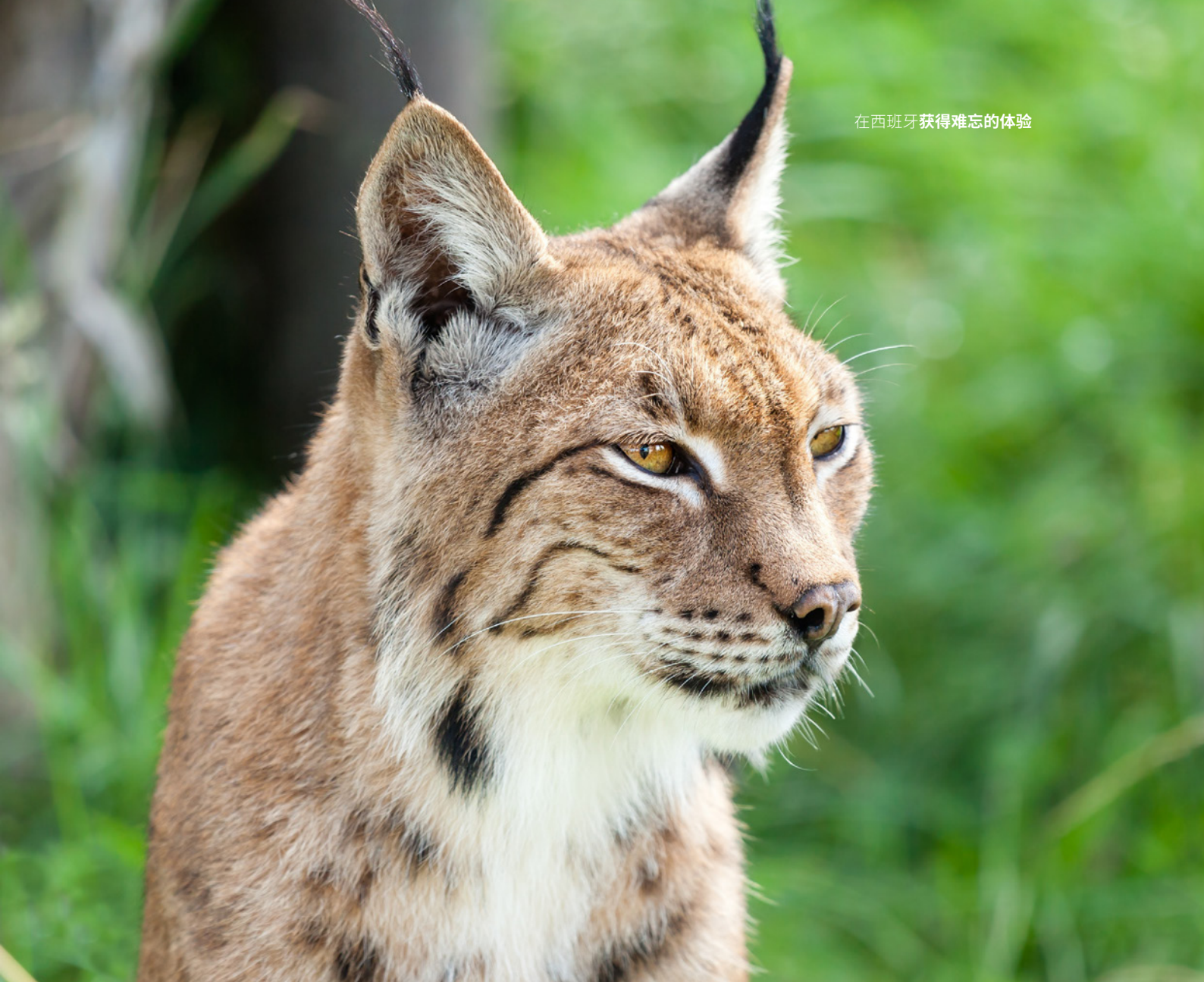
▲ 伊比利亚猞猁 多尼亚纳国家公园 (DOÑANA)