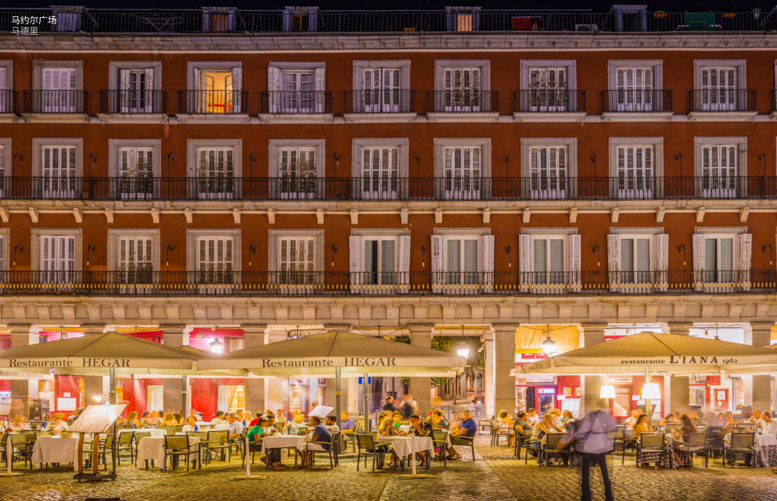
马约尔广场 马德里