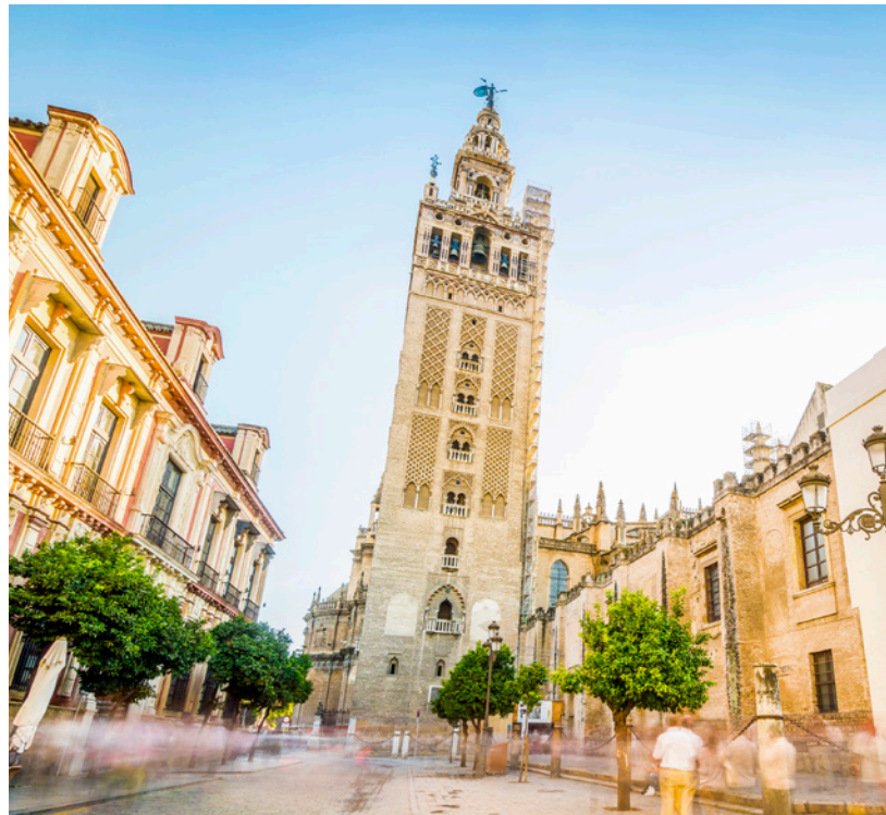
▲ 吉拉尔达钟楼 (LA GIRALDA) 塞维利亚