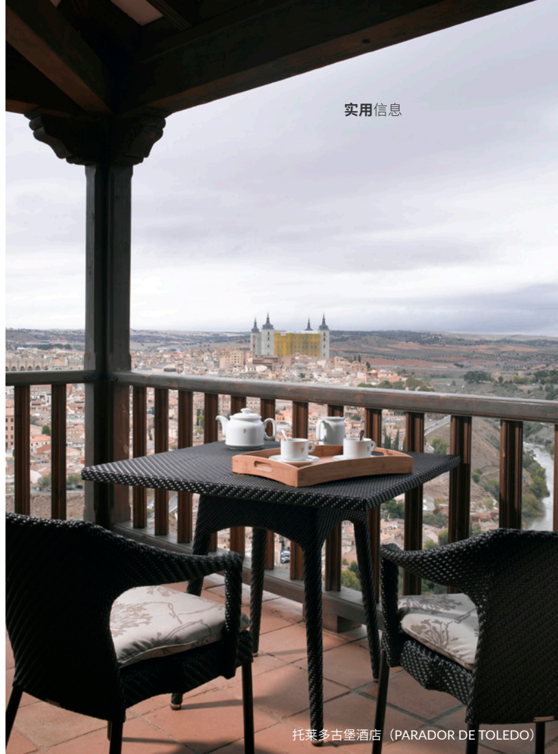
托莱多古堡酒店 (PARADOR DE TOLEDO)

西班牙人的午餐时间比其他国家晚一些。早餐通常在早上8点到10点之间。午餐从下午1点到3点半供应。至于晚餐，通常在20:30至23点进行。