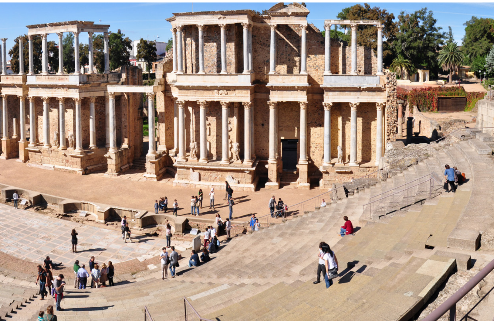
▲ 梅里达罗马剧场 (TEATRO ROMANO DE MÉRIDA)

艺复兴大学 (Antigua Universidad Renacentista) 或福卡雷斯庭院 (Patio de Fúcares)。该节日在七月庆祝，每年汇集6万多人。