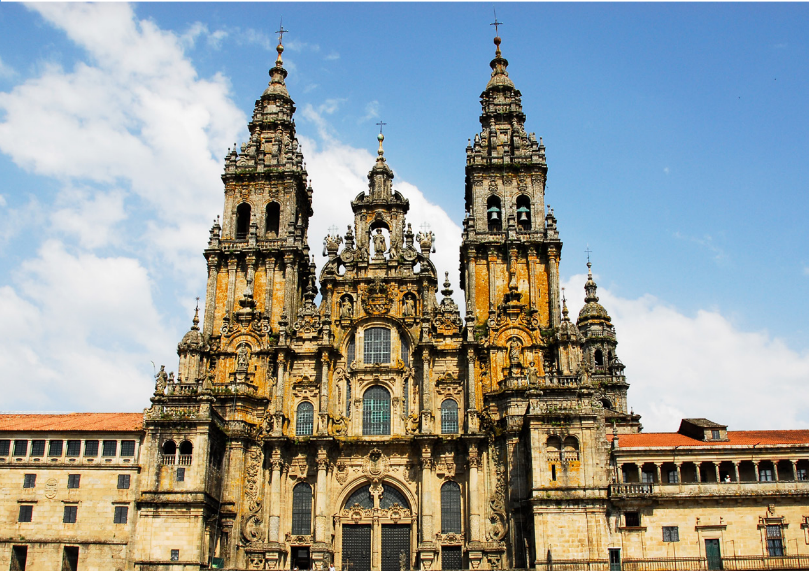
▲ 圣地亚哥大教堂 (CATEDRAL DE SANTIAGO) 圣地亚哥-德孔波斯特拉