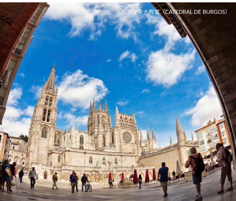
布尔戈斯大教堂 (CATEDRAL DE BURGOS)