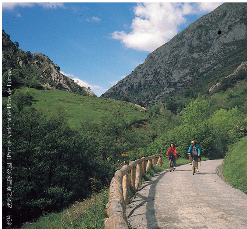
▲ 黑熊小径的绿色轨道 (VÍA VERDE SENDA DEL OSO) 阿斯图里亚斯