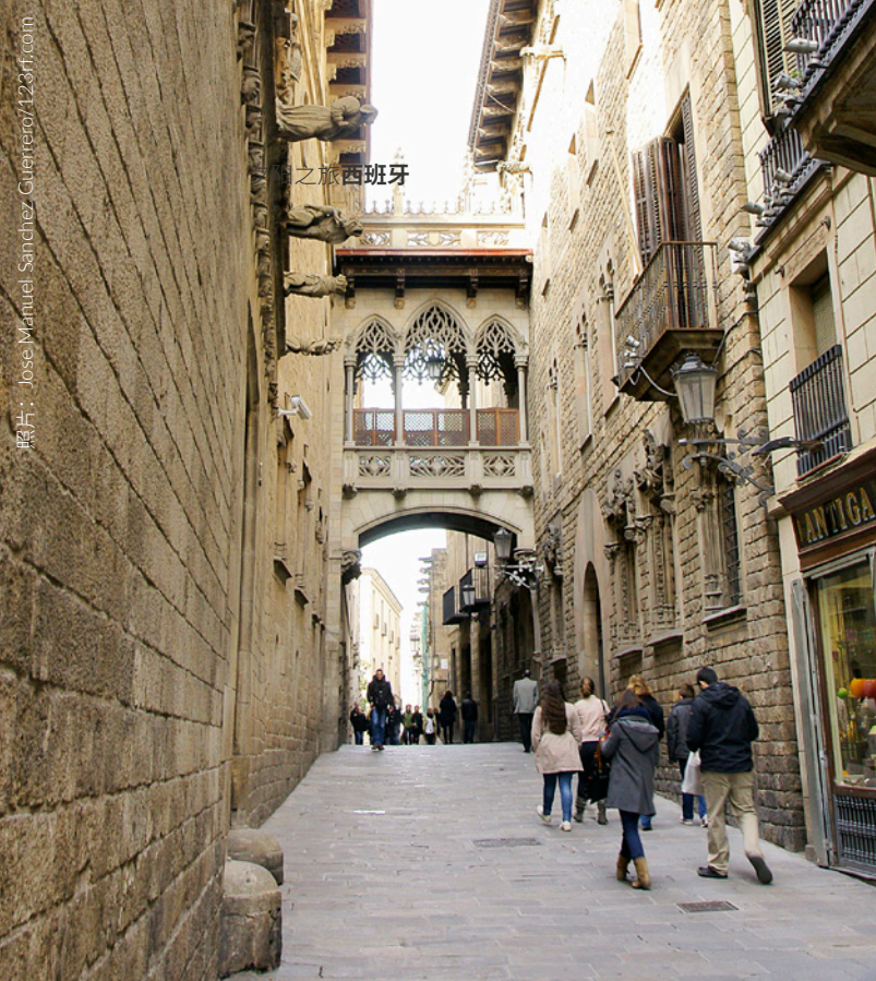
▲ 哥特区 (BARRIO GÓTICO) 巴塞罗那