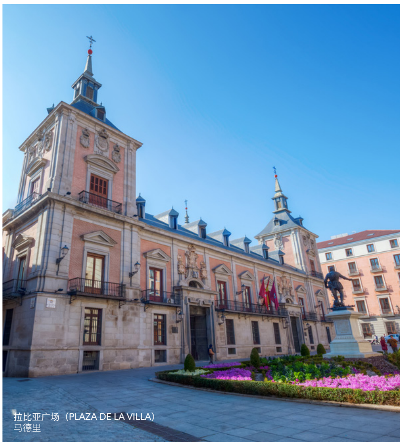
拉比亚广场 (PLAZA DE LA VILLA) 马德里