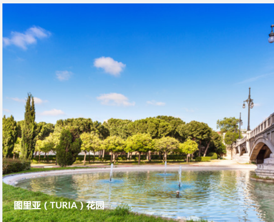
图里亚 (TURIA) 花园

到历史悠久，植被茂密的雷阿尔花园欣赏多个雕塑和喷泉，这座花园初建时为阿拉伯风格。