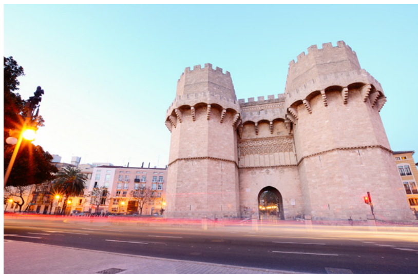
▲ 塞拉诺塔楼（TORRES DE SERRANO）