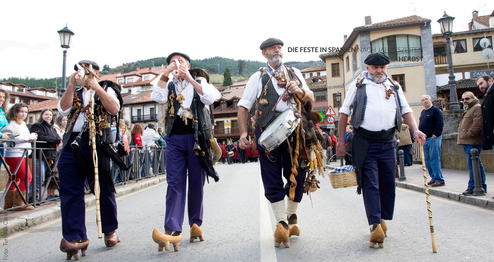
DIE FESTE IN SPANIEN NACH JAHRESZEITEN HERBST