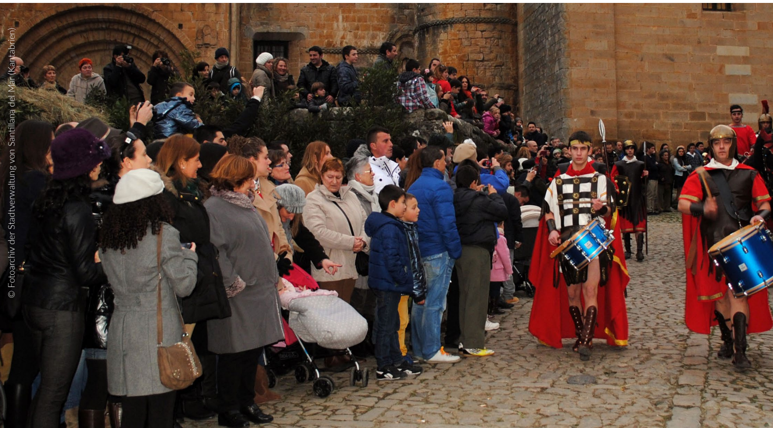
▲ EUCHARISTISCHES FESTSPIEL UND UMZUG DER HEILIGEN DREI KÖNIGE SANTILLANA DEL MAR