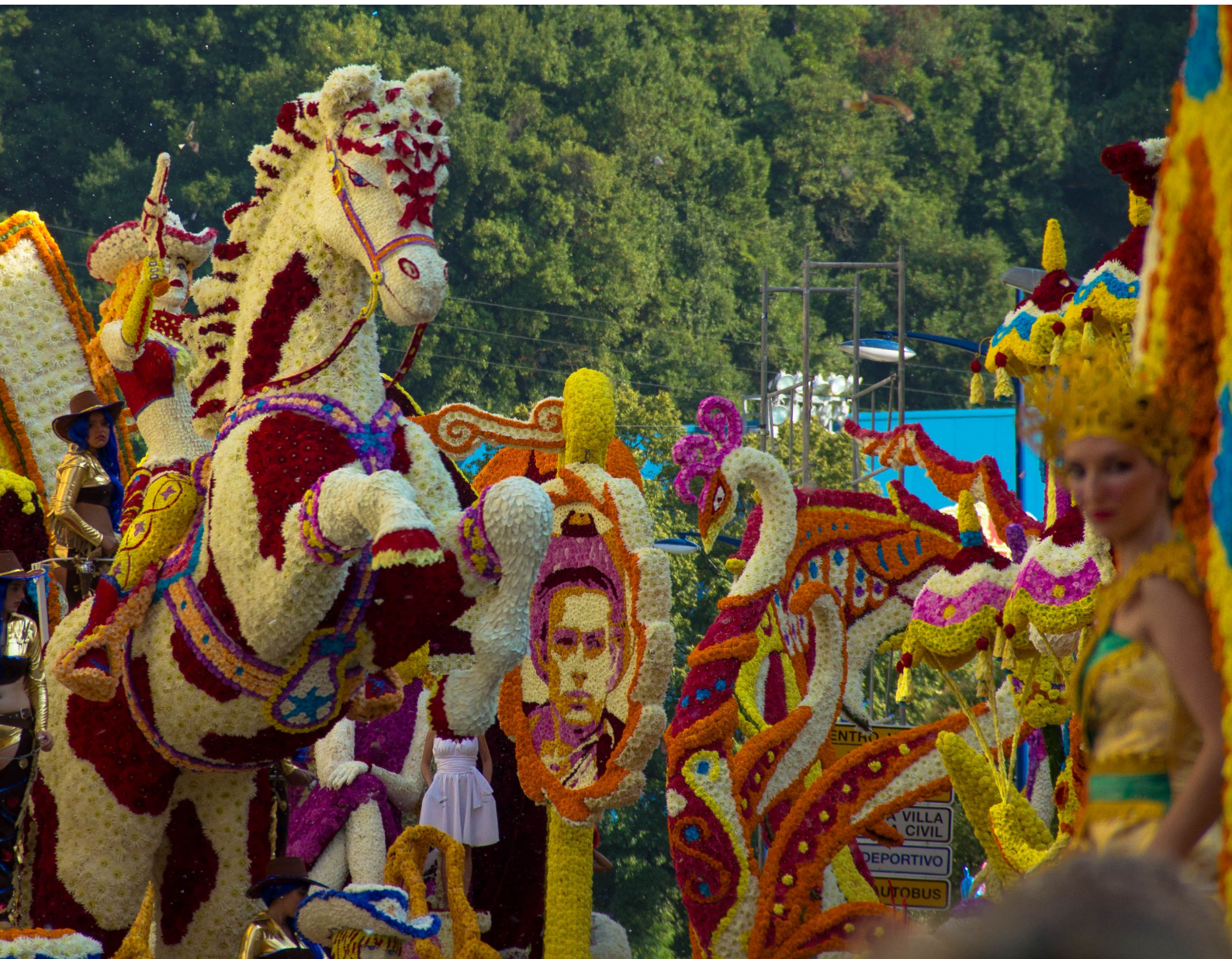
▲ BLUMENSCHLACHT LAREDO