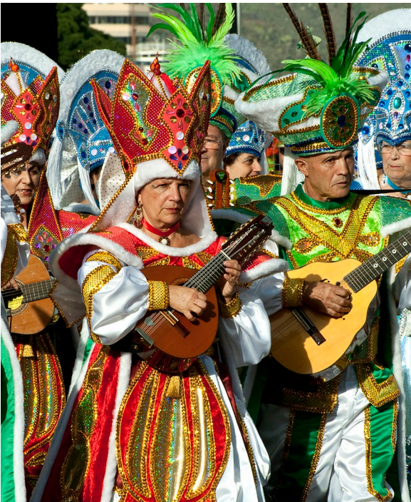
▲ KARNEVAL SANTA CRUZ DE TENERIFE