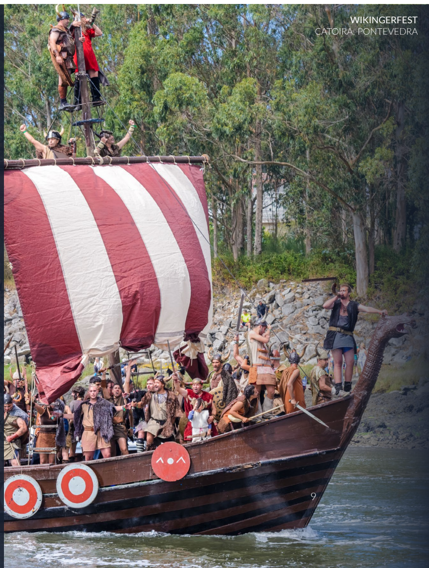
WIKINGERFEST CATOIRA, PONTEVEDRA

📍 Wo: Catoira (Pontevedra, Galicien) Wann: erster Sonntag im August www.catoira.gal/es/turismo/romaria-vikinga/