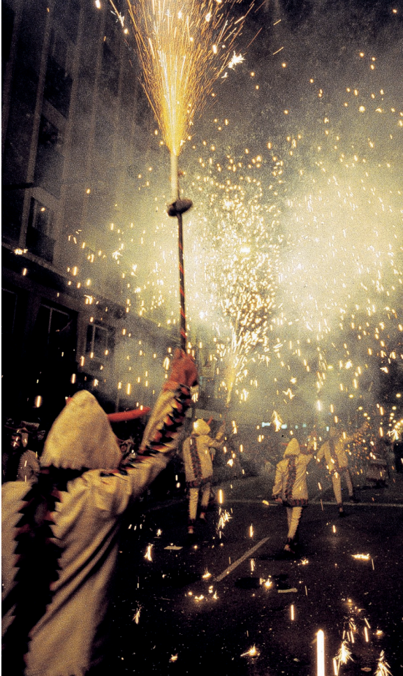
▲ BESEITZUNG DER SARDINE MURCIA