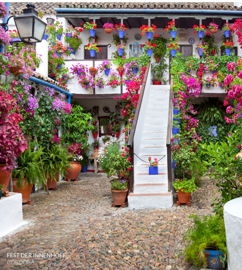
FEST DER INNENHÖFE CÓRDOBA