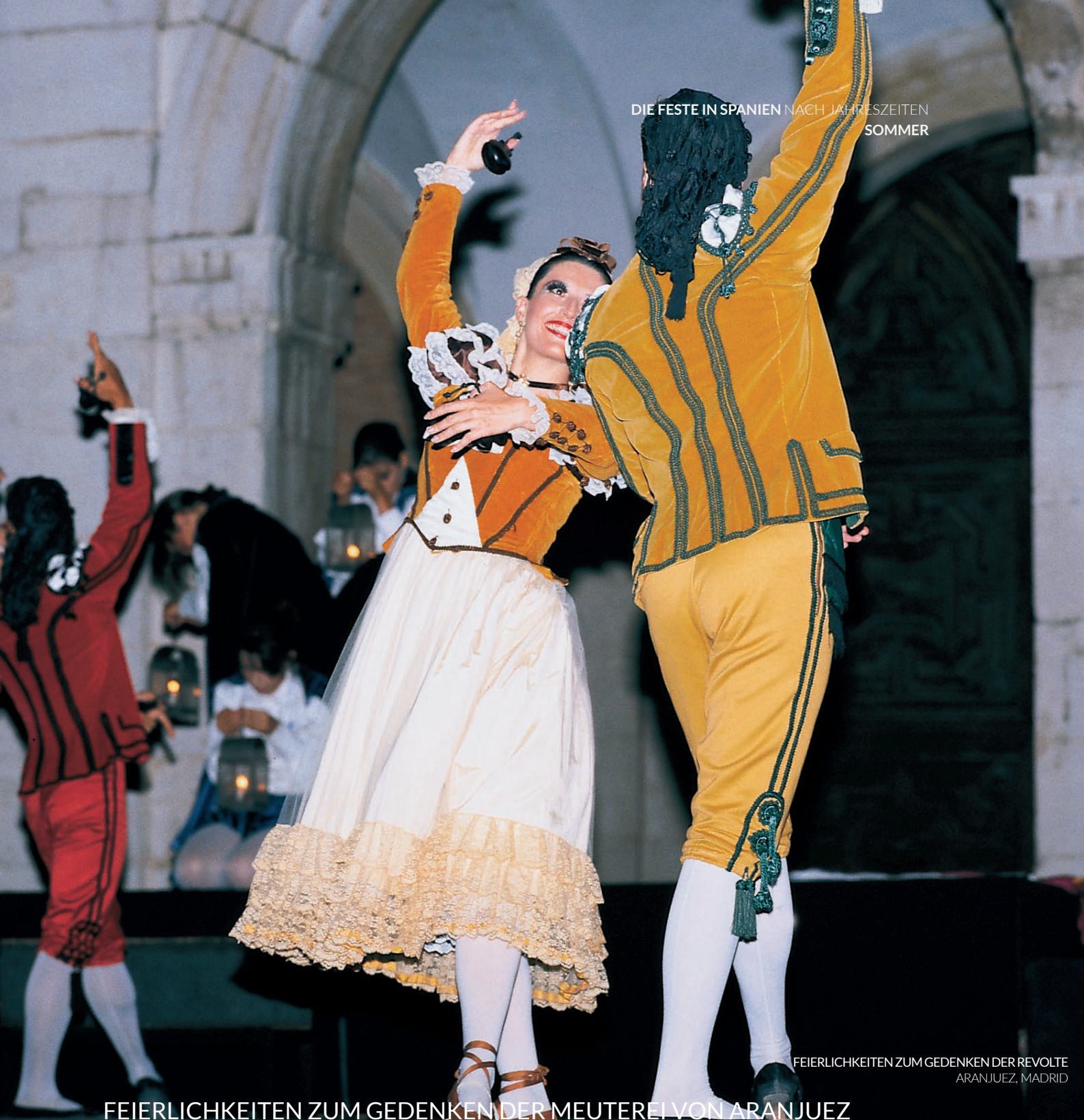
FEIERLICHKEITEN ZUM GEDENKEN DER REVOLTE ARANJUEZ, MADRID