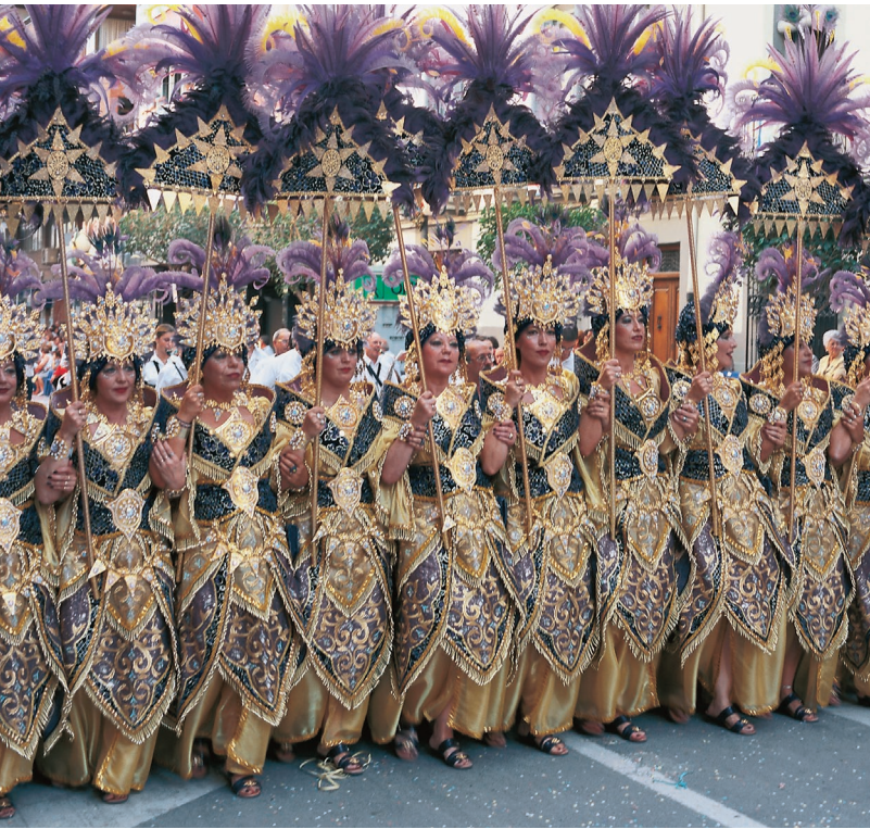
▲ FEST DER MAUREN UND CHRISTEN VILLENA, ALICANTE