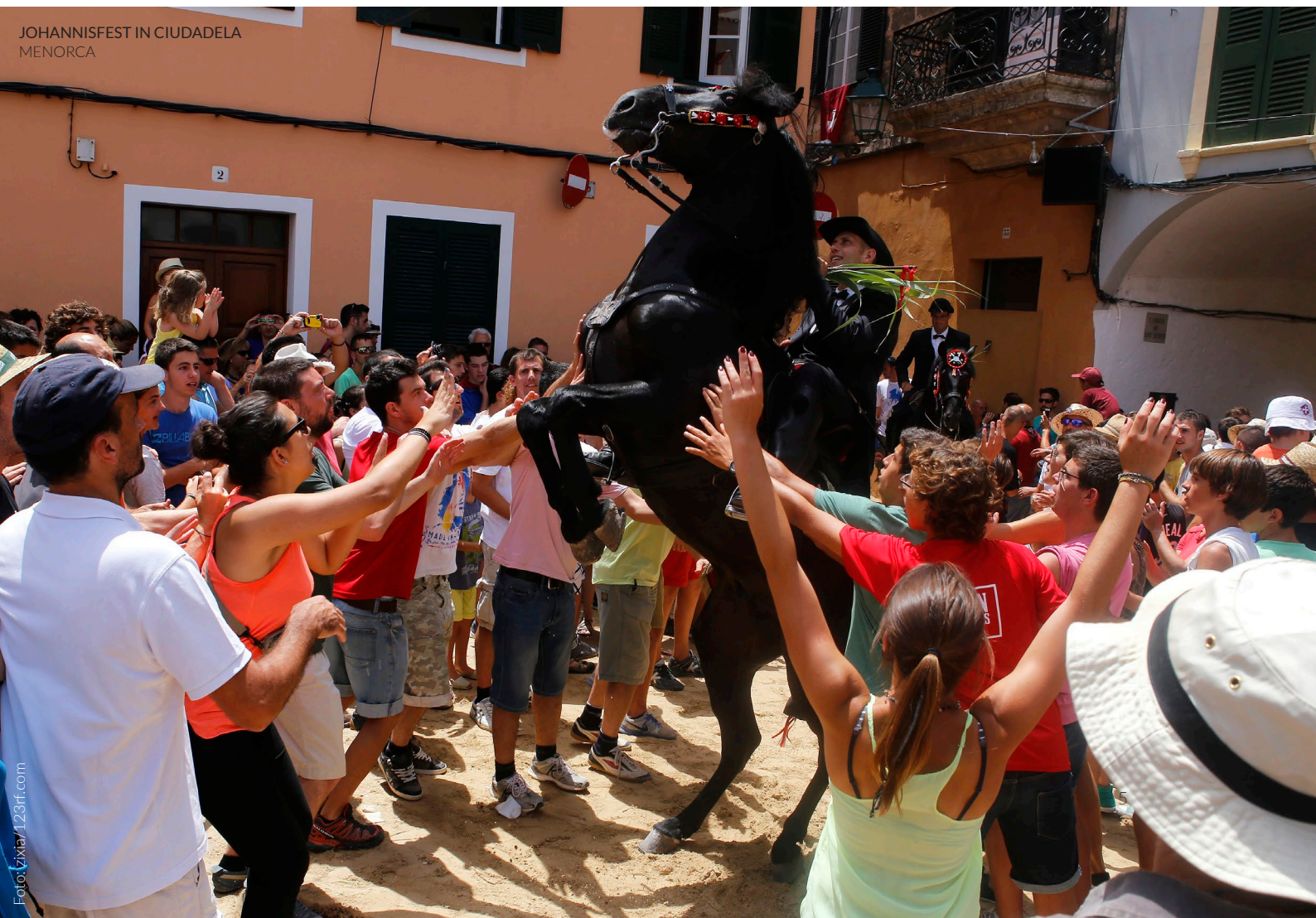
JOHANNISFEST IN CIUDADELA MENORCA