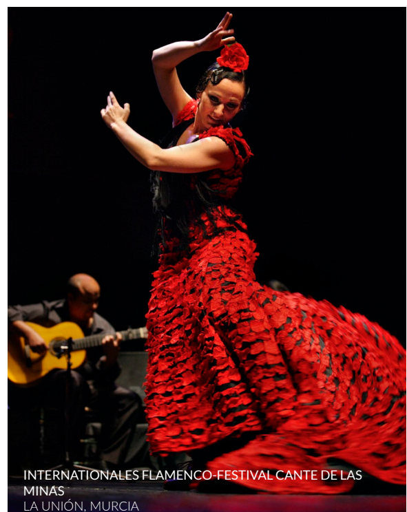
INTERNACIONALES FLAMENCO-FESTIVAL CANTE DE LAS MINAS LA UNIÓN, MURCIA