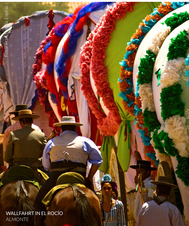
WALLFAHRT IN EL ROCÍO ALMONTE

📍 Wo: Almonte (Huelva, Andalusien) Wann: Im Mai www.andalucia.org