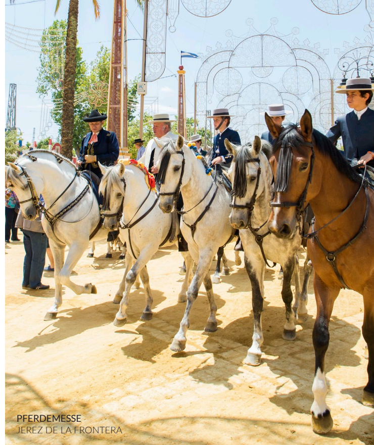
PFERDEMESSE JEREZ DE LA FRONTERA