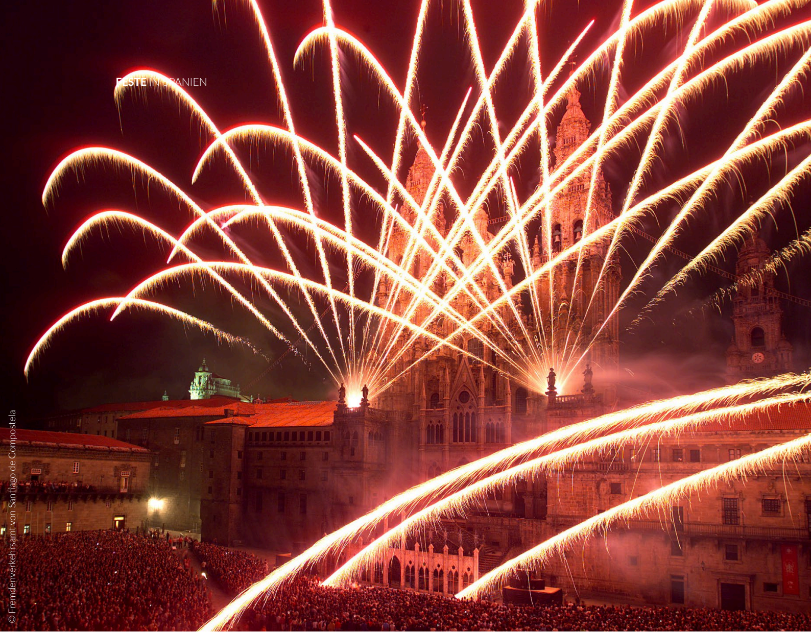
▲ FEST ZU EHREN DES SCHUTZHEILIGEN SANTIAGO APÓSTOL SANTIAGO DE COMPOSTELA