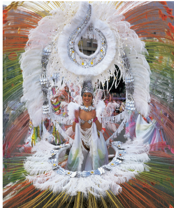
▲ KARNEVAL SANTA CRUZ DE TENERIFE

Das Auffälligste am Karneval von Santa Cruz de Tenerife ist sein spektakulärer Charakter. Die Bewohner von Teneriffa arbeiten das ganze Jahr über an den Vorbereitungen für ihr wichtigstes Fest, für das sie Festwagen und Fantasiekostüme entwerfen. Die Wahl der Karnevalskönigin findet internationale Aufmerksamkeit. Dabei präsentieren sich die Kandidatinnen mit grandiosen Gewändern, die bis zu 200 Kilogramm schwer sein können.