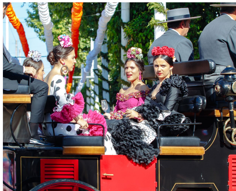
▲ FRÜHLINGSFEST FERIA DE ABRIL SEVILLA

📍 Wo: Sevilla (Andalusien) Wann: im April www.visitasevilla.es