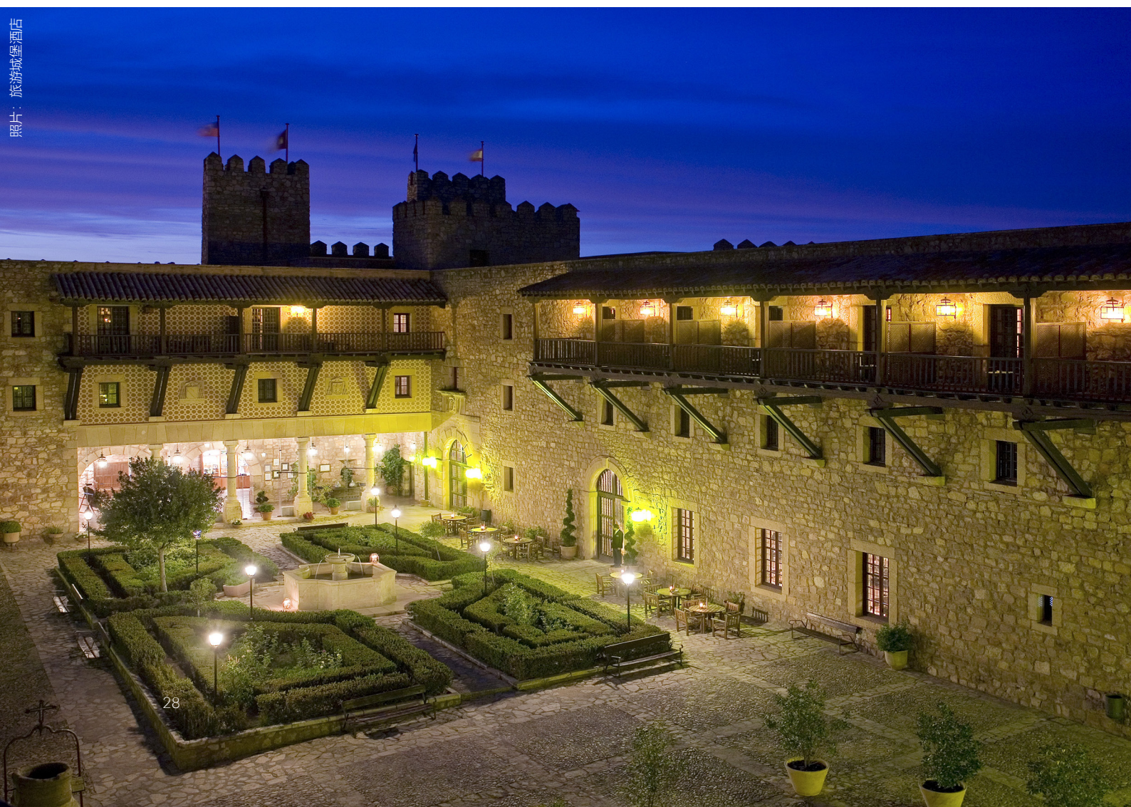
▼ 希昆萨城堡酒店 瓜达拉哈拉

你也可以租用私人别墅，这里你可以在一个只属于你和你旅伴的空间内享受高端的住宿和私密的氛围。此外你还可以享受绝佳的运动设施及各种服务，从厨师到个人休闲计划应有尽有。