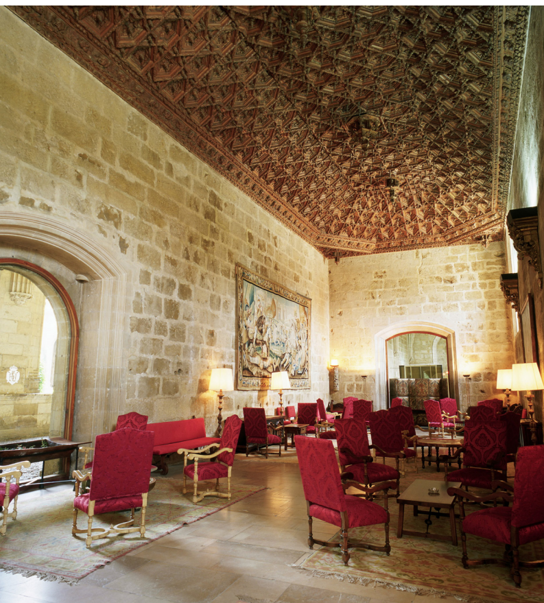
▲ 古堡酒店 莱昂

在西班牙的不同地区你都可以找到特色迷人的住宿。不管你选择去哪里，都会让你惊艳无比。其中最奢华的会为你提供如私人按摩，内设土耳其浴并且可以看见风景的套房，私人厨师，独立菜园等等。在安达卢西亚的农舍中体验正宗浓郁的西班牙风味吧。这些迷人的有着精心装点的白墙房屋，橄榄油的田野以及橙花的清香，为你的身心放松提供最舒适的环境。在阿斯图里亚斯的贵族老宅或者加利西亚乡间别墅中，观赏环绕的群山与大海吧。或者你还可以选择住在位于极富个性的古老建筑中的 Extremadura 旅舍。