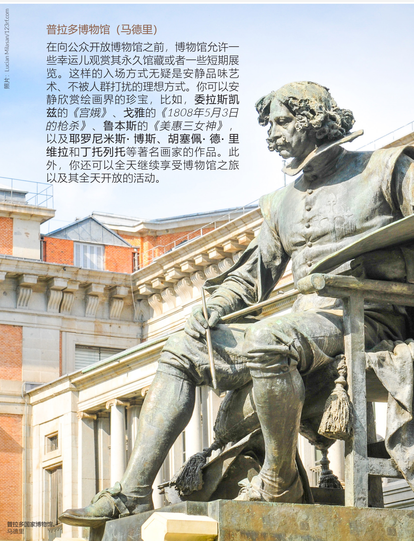
普拉多国家博物馆，马德里