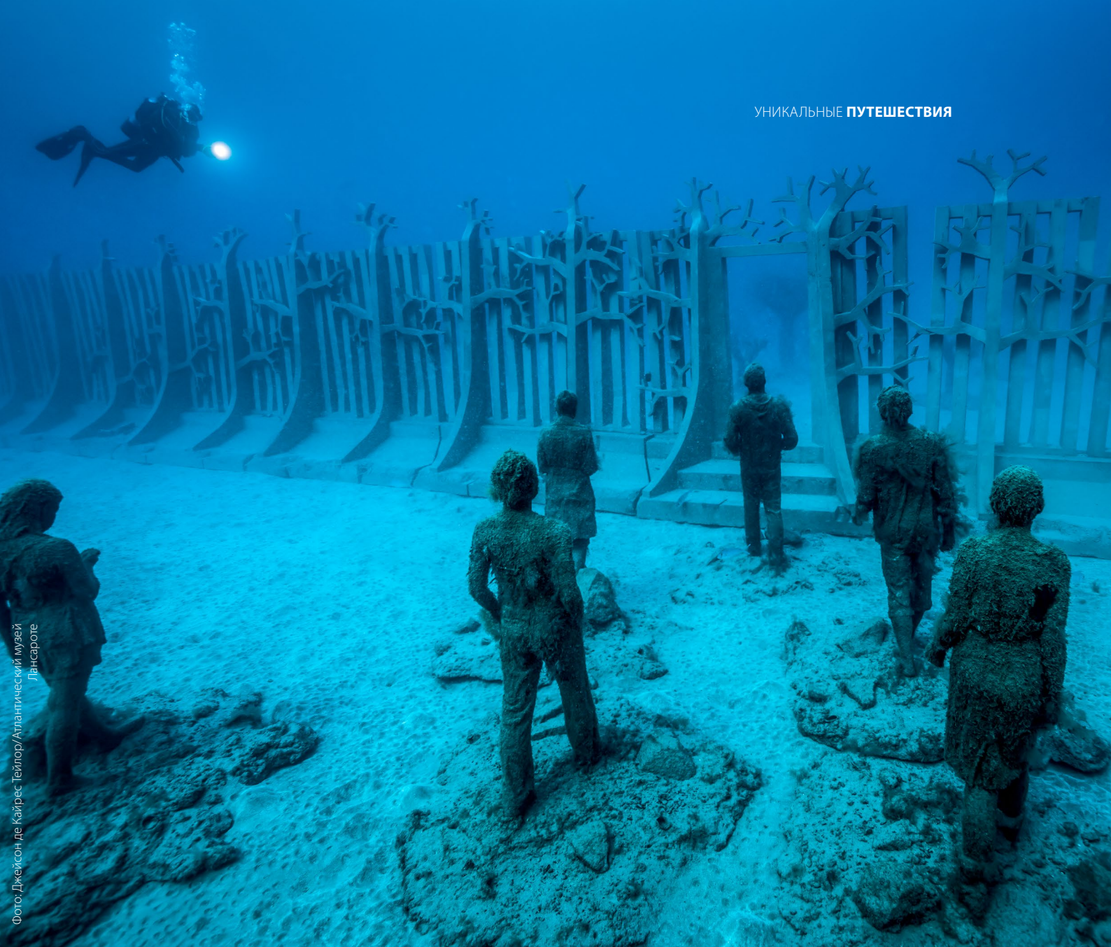
Фото: Джейсон де Кайрес Тейлор/Атлантический музей Лансароте