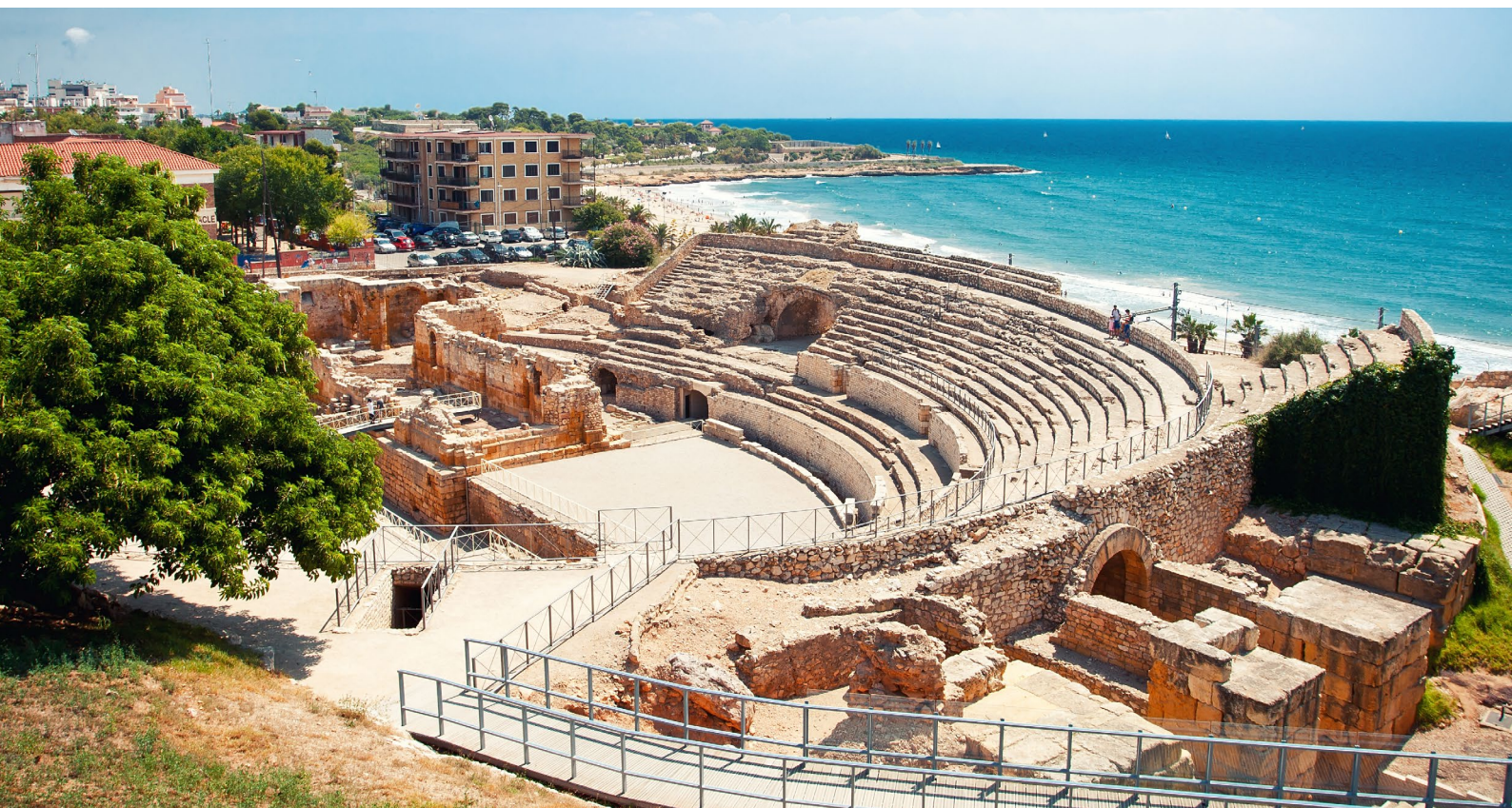
▲ РИМСКИЙ АМФИТЕАТР ТАРРАГОНА