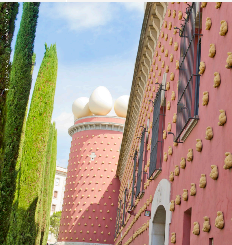
▲ ТЕАТР-МУЗЕЙ ДАЛИ ФИГЕРЕС

Среди прекрасных пейзажей Кадакеса находится небольшой приморский городок Портльигат, где можно посетить дом-музей Дали — рыбацкую постройку, в которой художник провел несколько продолжительных периодов своей жизни. В мастерской вы сможете увидеть рабочие инструменты, а снаружи здания — многие сюрреалистические творения художника.