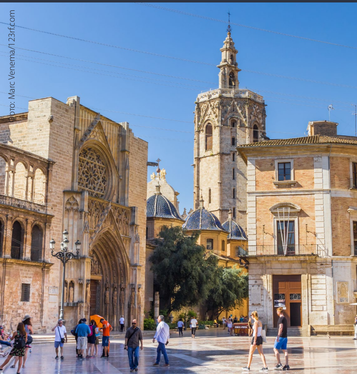
▲ КАФЕДРАЛЬНЫЙ СОБОР ВАЛЕНСИИ ВАЛЕНСИЯ