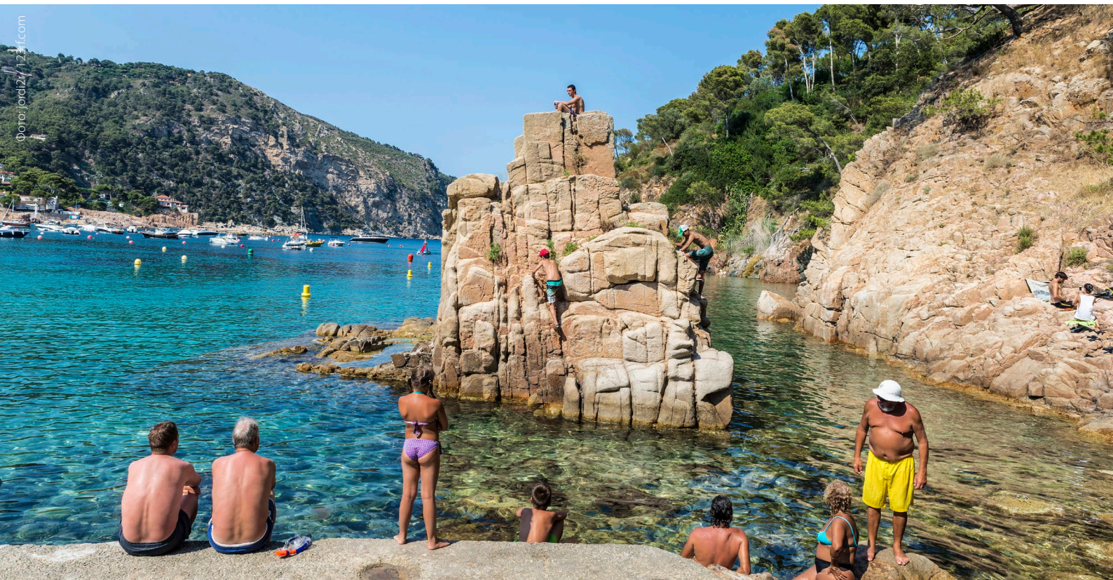
▲ ПЛЯЖ АЙГУАБЛАВА БЕГУР, ЖИРОНА

площадки залива Розес и исторического центра Ла-Эскалы. Совсем рядом с пляжем также находятся греко-римские руины Эмпуриеса , одного из важнейших археологических памятников Испании.