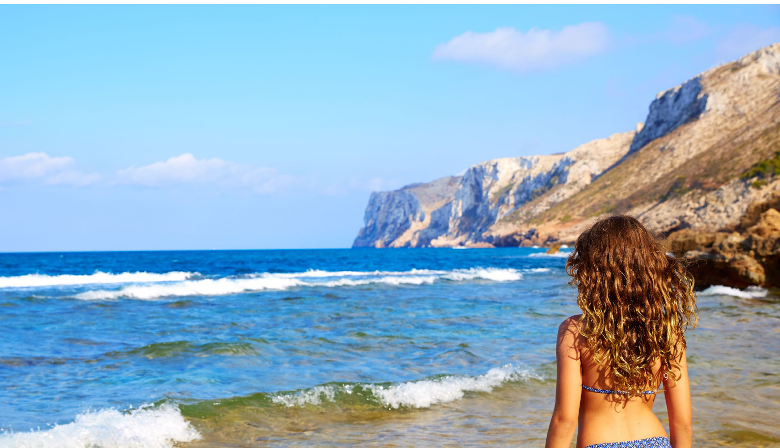
▼ ДЕНИЯ АЛИКАНТЕ