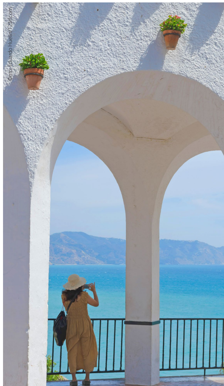
▲ БАЛКОН ЕВРОПЫ НЕРХА, МАЛАГА

Под Балконом Европы , круглой площадью над морем, которая превратилась в самое знаковое место Нерхи, можно искупаться на пляже Калаонда . На этом пляже из гальки и серого песка есть все необходимые удобства и услуги, а находится он совсем