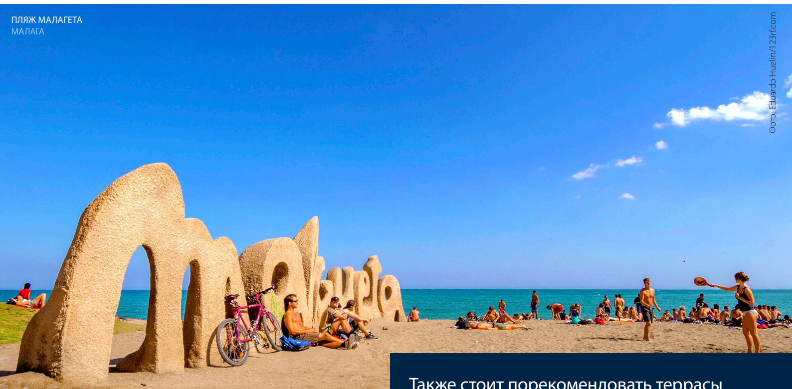
ПЛЯЖ МАЛАГЕТА МАЛАГА

Также стоит порекомендовать террасы местных баров и ресторанов, особенно вечером, когда с них можно полюбоваться незабываемым закатом.