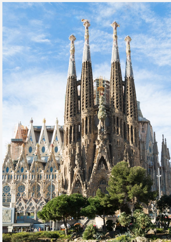
▲ ХРАМ СВЯТОГО СЕМЕЙСТВА БАРСЕЛОНА

В самом сердце Барселоны можно увидеть храм Святого Семейства — символ города и наиболее характерный образец модернизма. Ваш взгляд на творение гениального архитектора Антонио Гауди будет прикован к его остроконечным башням.