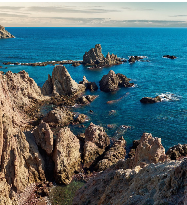
▲ ПРИРОДНЫЙ ПАРК КАБО-ДЕ-ГАТА АЛЬМЕРИЯ