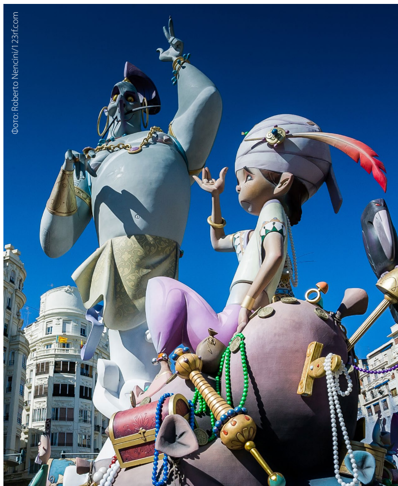
▲ ПРАЗДНИК ФАЛЬЯС ВАЛЕНСИЯ

В нескольких шагах отсюда стоит посетить Эль-Мигелете — под этим названием известна колокольня кафедрального собора Валенсии. С высоты 50 метров перед вами откроется впечатляющий вид на город.