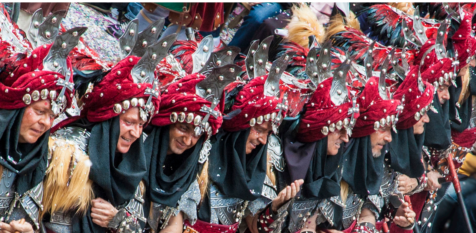
▲ ПРАЗДНИК «МАВРЫ И ХРИСТИАНЕ» АЛЬКОЙ, АЛИКАНТЕ