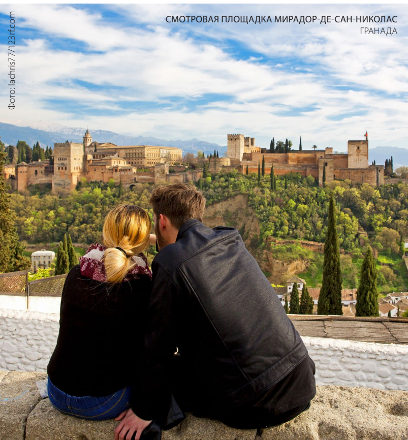
СМОТРОВАЯ ПЛОЩАДКА МИРАДОР-ДЕ-САН-НИКОЛАС ГРАНАДА

Прогуляйтесь по местным садам, слушая журчание воды в фонтанах и прудах, полюбуитесь обильными украшениями эпохи насридов, и вы будете очарованы потрясающей красотой этого места.