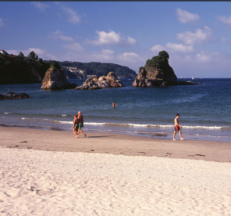
▲ PLAGE DE COVAS - OS CASTELOS VIVEIRO, LUGO

Quatre jours, quatre scènes et cent groupes entre hard rock, hardcore , punk, heavy metal et toutes leurs variantes. Voilà le résumé de la proposition implacable du Resurrection Fest, qui se déroule habituellement fin juin-début juillet au cœur du superbe cadre naturel du village de pêcheurs de Viveiro (dans la province de Lugo).