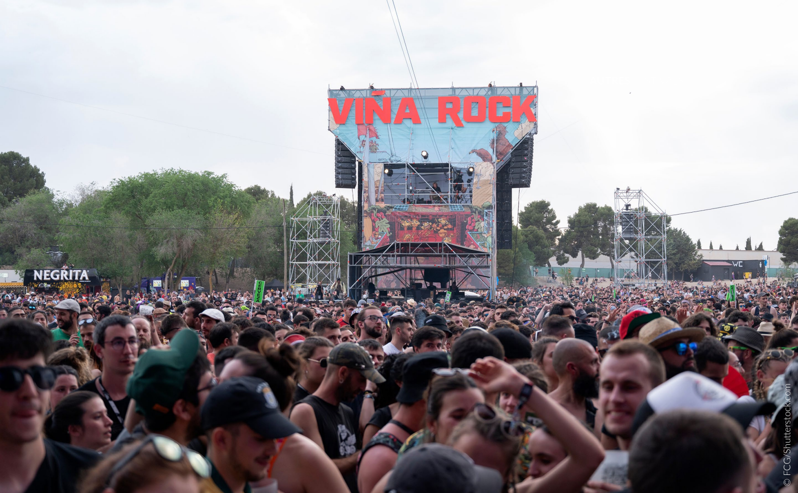
FESTIVAL VIÑA ROCK VILLARROBLEDO, ALBACETE