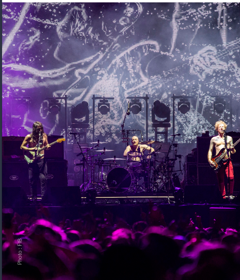
▲ FESTIVAL INTERNATIONAL DE BENICÀSSIM (FIB)

Impossible de s'y ennuyer. Ainsi, tous les mois de juillet, des milliers de mélomanes du monde entier viennent emplir les rues de Benicàssim, au cœur de la Costa del Azahar , dans la province de Castellón (région de Valence). Pendant plusieurs jours, vous pourrez découvrir de nouveaux talents et voir des artistes consacrés conquérir leur public dans les différents espaces et chapiteaux de l'enceinte.