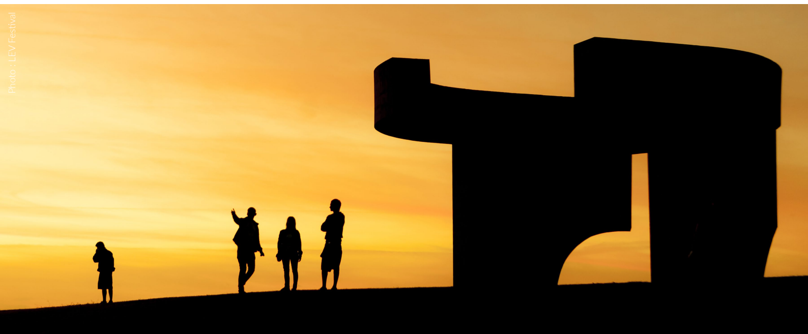
▲ ELOGIO DEL HORIZONTE GIJÓN