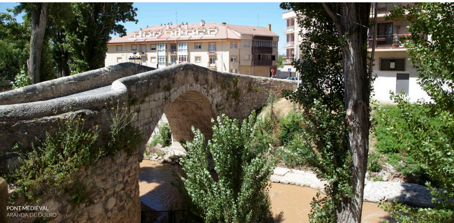
PONT MÉDIÉVAL ARANDA DE DUERO

Les dernières éditions ont intégré de nouvelles propositions consacrées à la musique ibéro-américaine au parc de La Isla , et à la thématique et aux sons des années 60 sur la place Arco Pajarito .