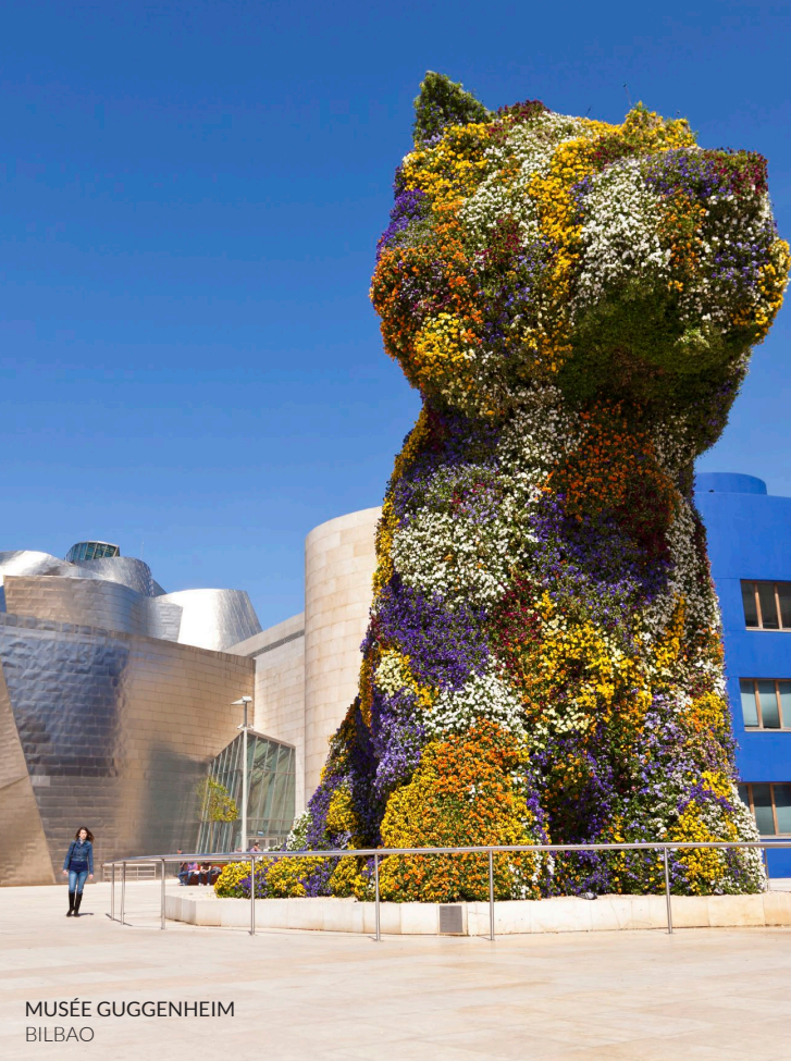
MUSÉE GUGGENHEIM BILBAO

En plus de l'affiche irréprochable qu'il présente chaque année, l'enceinte de Kobetamendi où il se déroule est un autre de ses points forts. Elle occupe un site idyllique, sur l'une des montagnes qui entourent la ville, dans une petite forêt qui accueille Basoa (forêt en basque), la zone de DJ du festival. Trois grandes scènes et un chapiteau viennent la compléter pour profiter du meilleur de la pop, du rock et de la musique électronique de la planète.