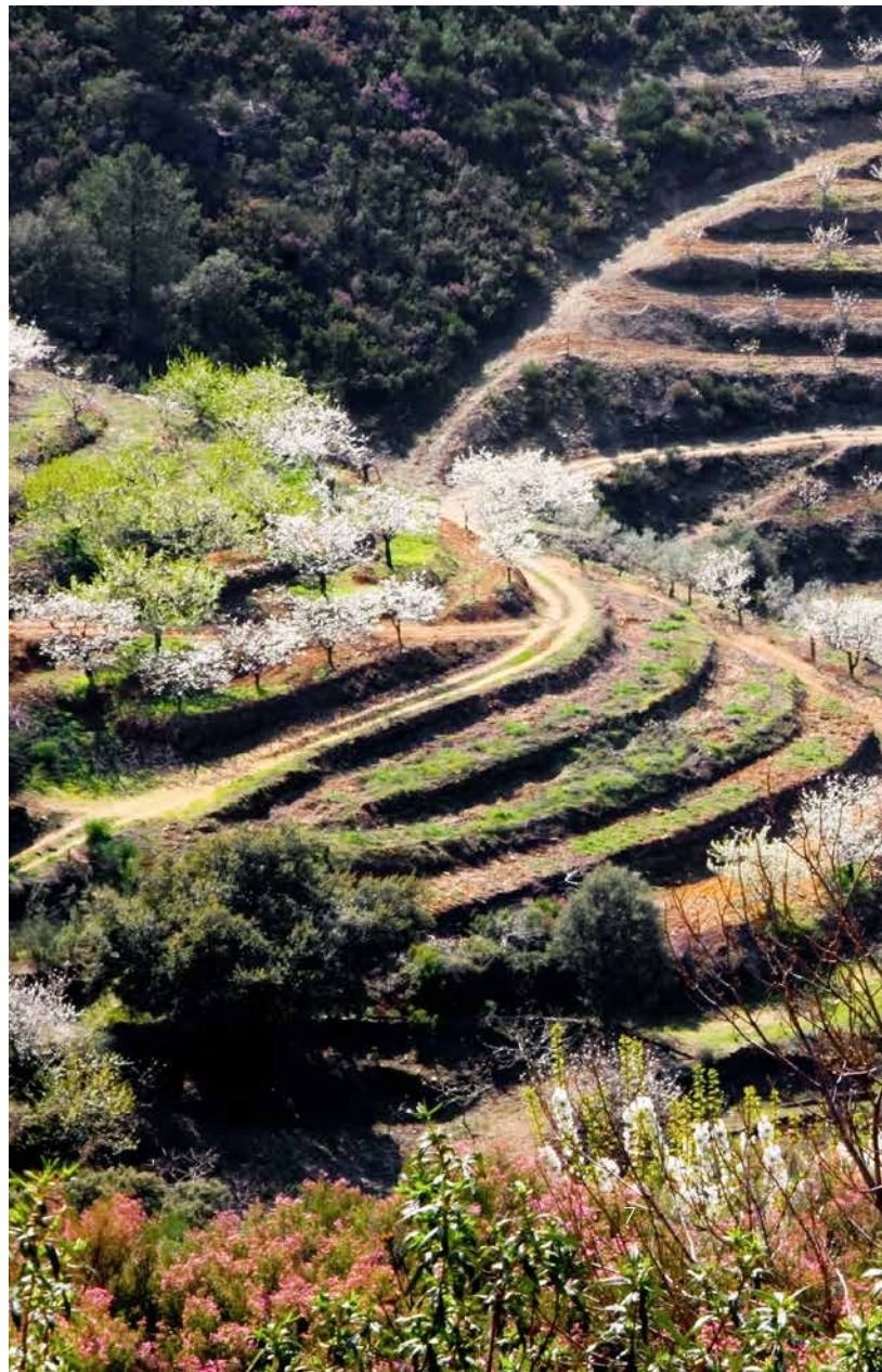
▼ DOLINA JERTE CÁCERES