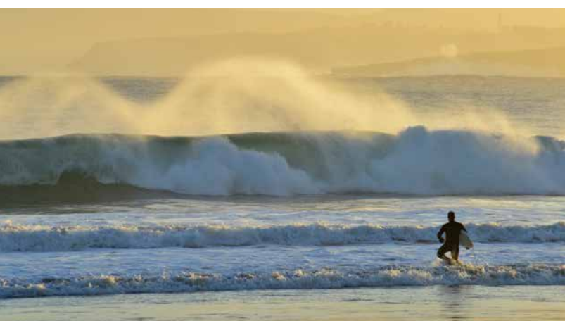
▲ LAREDO KANTABRIA

Podążaj śladami Karola V po jego abdykacji. Monarcha przybył do północnej Hiszpanii z Brukseli na czele flotyli ponad 50 statków, skąd wyruszył w dalszą drogę przez Kantabrię, Kastylię i León oraz Estremadurę , aż dotarł do klasztora w Yuste , gdzie spędził resztę swojego życia.