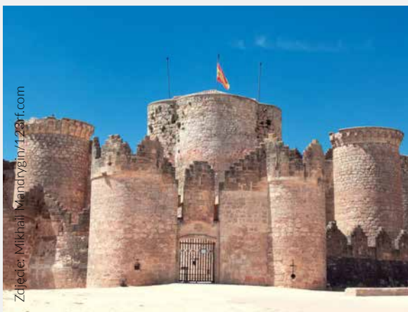
▲ ZAMEK BELMONTE CUENCA

Zamek La Mota w prowincji Valladolid, zamek Loarre w prowincji Huesca, zamek Almodóvar del Río w prowincji Kordoby i wiele innych wspaniałych zamków rozmieszczonych jest po całym hiszpańskim terytorium. Popytaj w biurach informacji turystycznej, gdyż każda wspólnota autonomiczna oferuje własny Szlak Zamków.