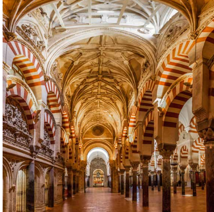
▲ MECZET-KATEDRA W KORDOBIE KORDOBA

Osiem wieków obecności muzułmanów odcisnęło głęboki ślad na całym Półwyspie Iberyjskim, ale to właśnie w Andaluzji ich kultura wydała najlepsze owoce. Odwiedź związane z nią miejsca