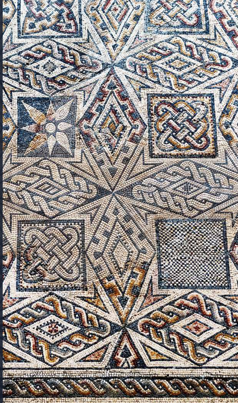
▲ MOZAIKA RZYMSKA MUZEUM NARODOWE SZTUKI RZYMSKIEJ MÉRIDA

W Estremadurze zobaczysz równiny pokryte polami uprawnymi, winnicami i łąkami. Będziesz zachwycony starym miastem Cáceres i stanowiskiem archeologicznym Méridy , wpisanymi na listę światowego dziedzictwa UNESCO. W prowincji Cáceres czekają na ciebie dwa malownicze miasteczka: Hervás , słynące z dzielnicy żydowskiej, z wąskimi i stromymi uliczkami, oraz Plasencia , z wyjątkowym kompleksem zabytków, w skład którego wchodzi dwie katedry, pałace i rezydencje szlacheckie. Zachwyci cię smak estremadurskiej szynki iberyjskiej, jednej z najlepszych w kraju oraz relaks w rzymskich łaźniach Baños de Montemayor .