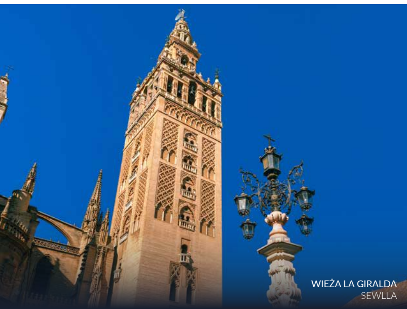
WIEŻA LA GIRALDA SEWILLA

Ten szlak poprowadzi cię również do malowniczych miast w prowincji Sewilli, takich jak Carmona , Marchena i Écija , oraz w prowincji Grenady, takich jak Alhama de Granada .