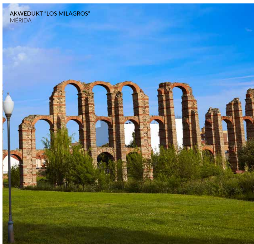
AKWEDUKT "LOS MILAGROS" MÉRIDA

W mieście Cáceres , w dawnym żydowskim kwartale, wewnątrz dzielnicy otoczonej murami, mieści się kaplica San Antonio , zbudowana w miejscu dawnej synagogi. Duże wrażenie zrobią na tobie bielone wapnem kamienice wykorzystujące mur jako tylną ścianę oraz strome uliczki.