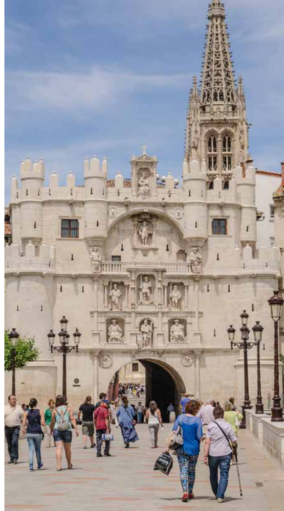
▲ BRAMA ARCO DE SANTA MARÍA BURGOS

Udaj się następnie do Kastylii i Leónu. Odwiedź średniowieczną Medina de Pomar (w prowincji Burgos), gdzie Karol V zatrzymał się na nocleg, oraz Alcázar de los Velasco , imponujący XIV-wieczny zamek. W historycznym Burgos przejdź przez jedną z dawnych bram warownych prowadzących do miasta, Arco de