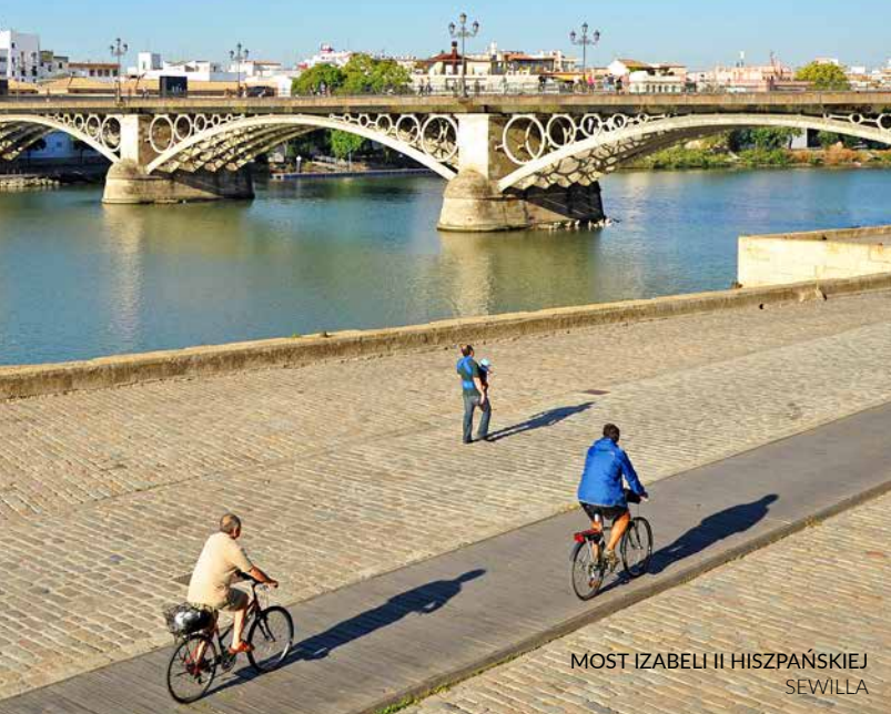
MOST IZABELI II HISZPAŃSKIEJ SEWILLA