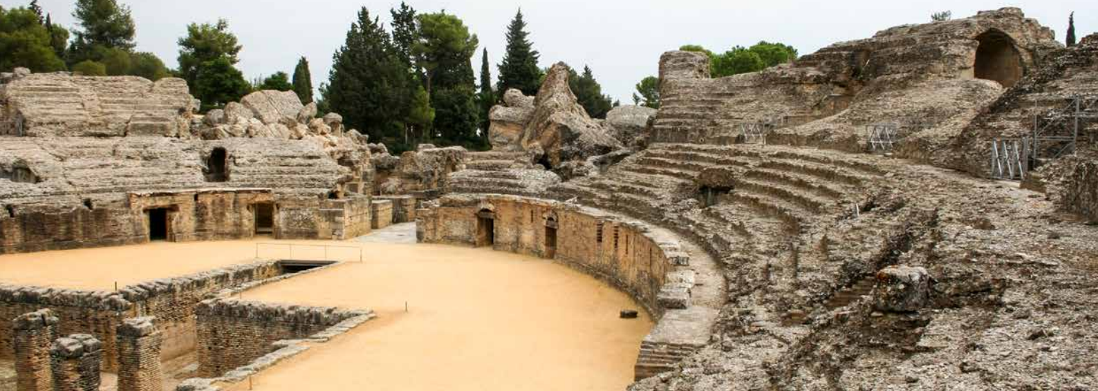
▲ AMFITEATR RZYMSKI DAWNEJ ITALIKI SANTIPONCE (SEWILLA)

Na Szlaku Almorawidów i Almohadów odkryjesz ślady ich imperium w postaci zamków i budowli obronnych. Trasa obejmuje 400 kilometrów i prowadzi od miasta Algeciras (Kadyks) do Grenady dwoma różnymi drogami. Jerez de la Frontera (Kadyks) oraz Ronda (Malaga) to tylko niektóre z miast, które odwiedzisz podczas podróży.