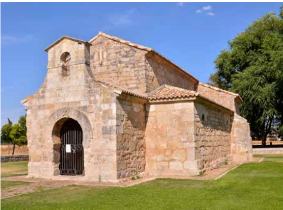
▲ KOŚCIÓŁ SAN JUAN DE BAÑOS VENTA DE BAÑOS (BURGOS)

Na ostatnim odcinku szlaku, w Estremadurze , czeka na ciebie wspaniała przyroda. Jeśli będziesz mieć okazję, aby przebyć tę trasę wiosną, zobaczysz kwitnące wiśnie w dolinie Valle del Jerte . Mile zaskoczy cię również rezerwat przyrody Garganta de los Infiernos z jego lodowcami. Może uda ci się zaobserwować lot orła cesarskiego lub sępa płowego. Szlak kończy się w klasztorze w Yuste, do którego Karol V nakazał dobudować rezydencję, gdzie mieszkał do końca swoich dni.