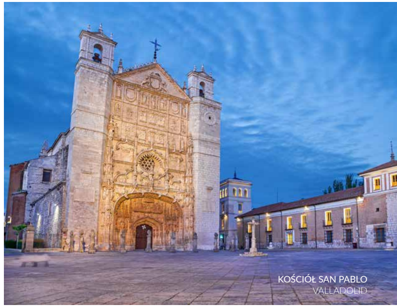
KOŚCIÓŁ SAN PABLO VALLADOLID