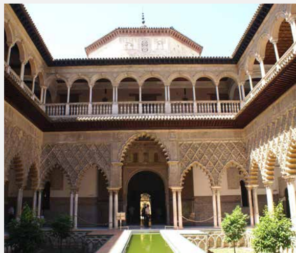
▲ PATIO LAS DONCELLAS W KRÓLEWSKIM ALKAZARZE W SEWILLI SEWILLA

cylindryczne wieże tworzą sześciopromienną gwiazdę. Jeśli wybierzesz się tu w okresie maja i czerwca, możesz wziąć udział w dniach rekonstrukcji historycznych na zamku, podczas których odtwarzane jest średniowieczne życie wojskowe we wszystkich jego aspektach.