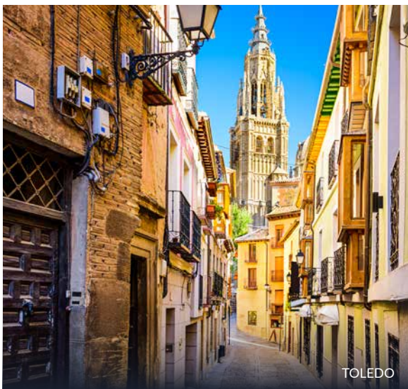
► POMNIK CERVANTESA TOLEDO