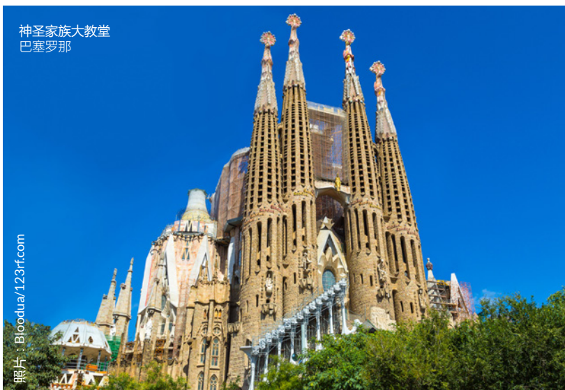
神圣家族大教堂 巴塞罗那