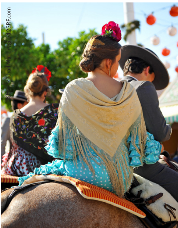
▲ 塞维利亚四月节 塞维利亚