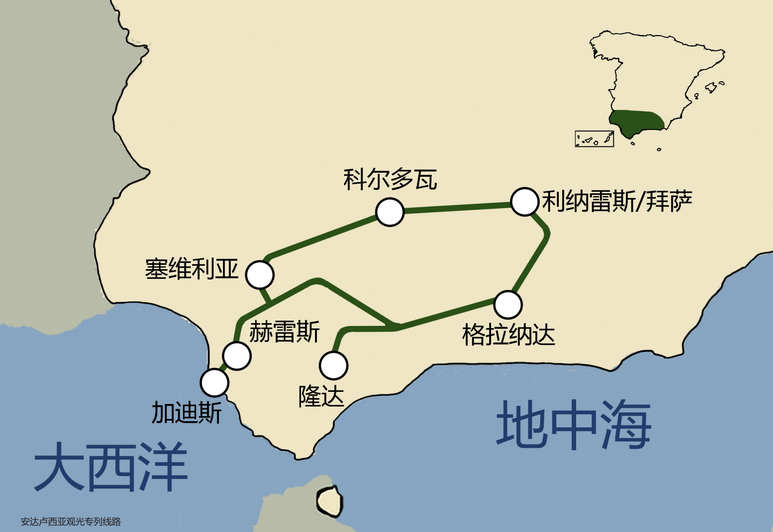
安达卢西亚观光专线线路