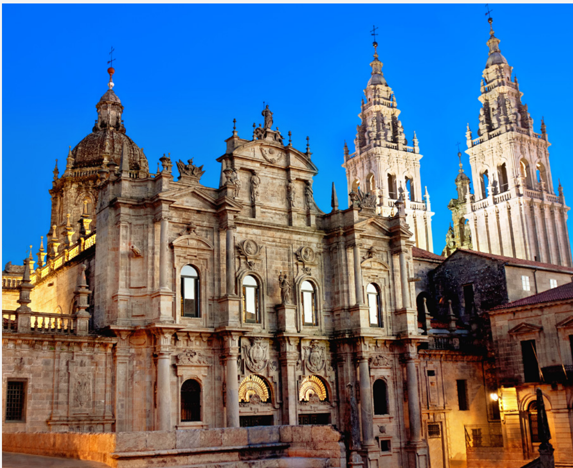
▲ 圣地亚哥大教堂 圣地亚哥-德孔波斯特拉