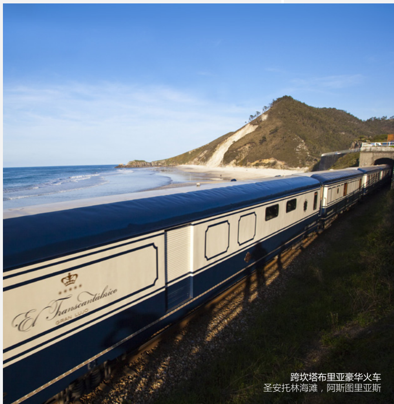
跨坎塔布里亚豪华火车 圣安托林海滩，阿斯图里亚斯

你可以在14间装饰精美的豪华套房中的一间休息，透过私人套房的车窗或是沙龙车厢的大落地窗，可以欣赏窗外壮丽的景色，沙龙车厢是1923年的原版，是具有历史意义的铁路瑰宝。