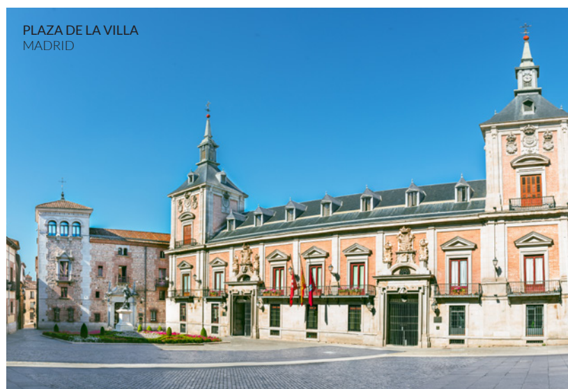
PLAZA DE LA VILLA MADRID

Enamórate de esta ciudad cosmopolita, vanguardista y mediterránea que te sorprenderá a cada instante. Recórrela a pie o en bicicleta y descubre sus barrios, Las Ramblas y su paseo marítimo. Siéntete en la edad media cuando estés inmerso en las callejuelas de su famoso barrio Gótico . Da un salto al Modernismo catalán con Antonio Gaudí: admira su impactante obra maestra, la Sagrada Familia , o el Parque Güell . Mira la nutrida agenda cultural de la ciudad y apúntate a exposiciones, conciertos, funciones... Deléitate con la gastronomía barcelonesa que conjuga tradición y creatividad en los fogones. Permítete un capricho: prueba la repostería artesana y sus vinos espumosos. También puedes llegar a Barcelona en AVE desde Málaga.