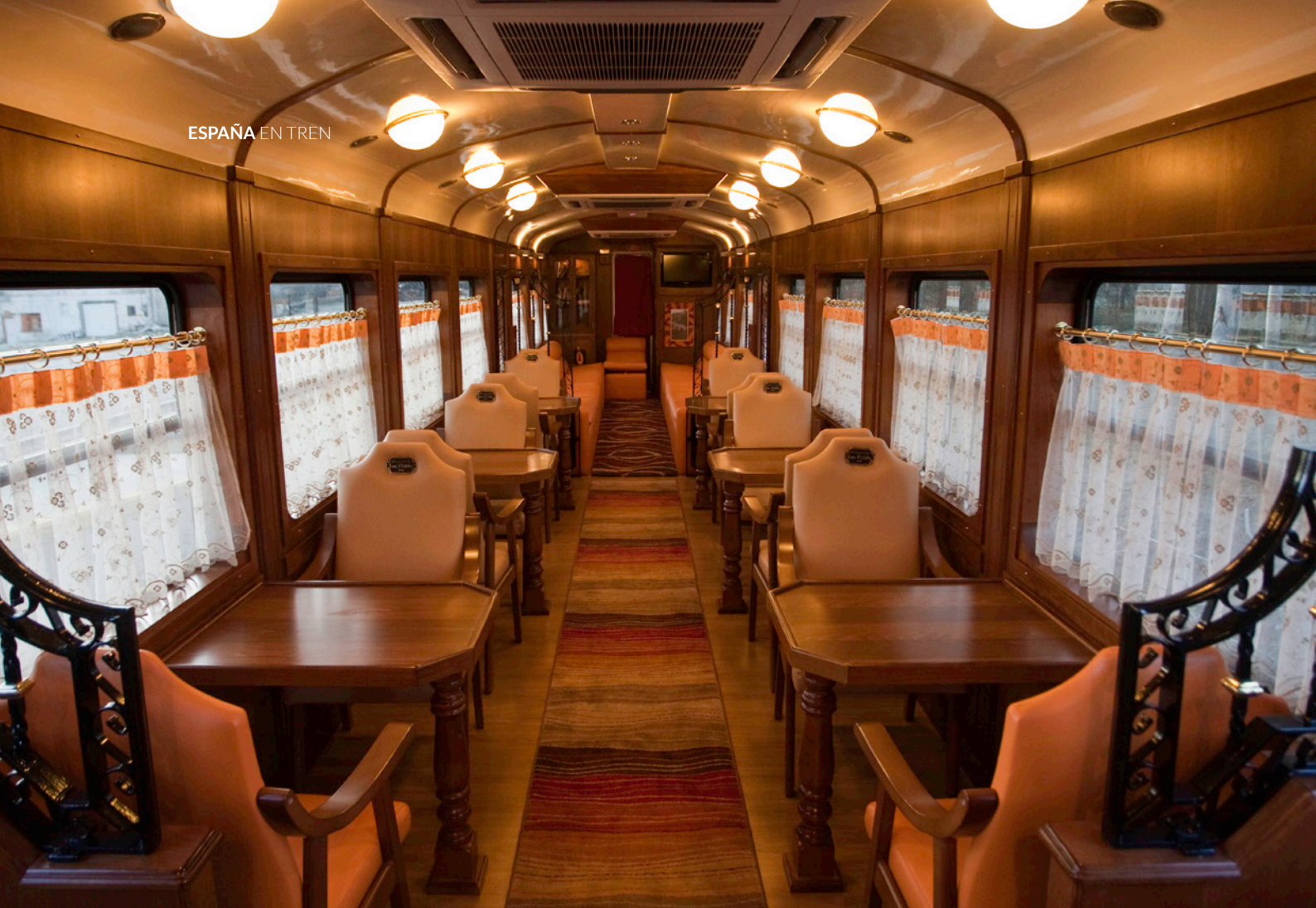
▲ TREN EXPRESO DE LA ROBLA