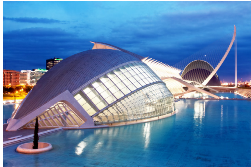
▲ CIUDAD DE LAS ARTES Y LAS CIENCIAS VALENCIA

❶ Consulta toda la información sobre trayectos y horarios del AVE aquí: www.renfe.com/viajeros/larga_distancia/productos/