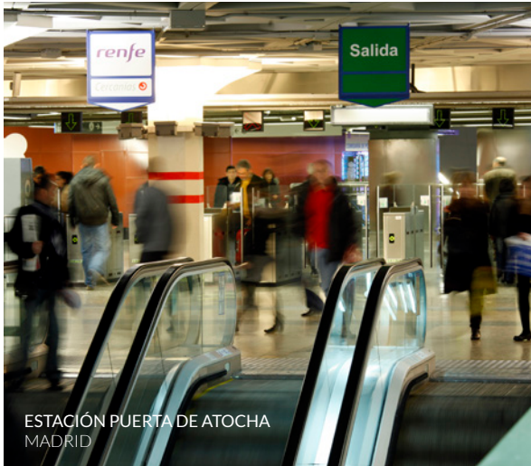
ESTACIÓN PUERTA DE ATOCHA MADRID

Hay más propuestas de viajes organizados en tren. Estas son solo algunas.