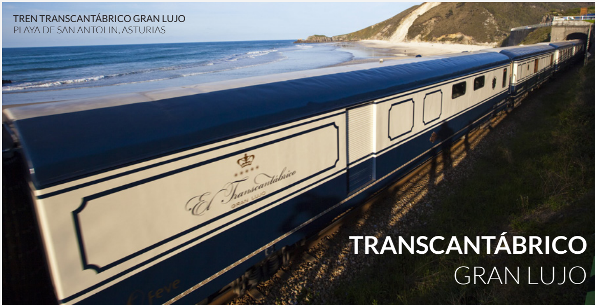
TREN TRANSCANTÁBRICO GRAN LUJO PLAYA DE SAN ANTOLIN, ASTURIAS