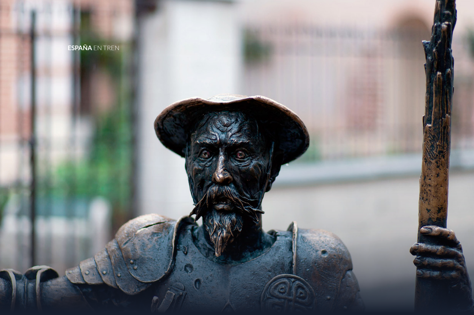
▲ ESCULTURA DE EL QUIJOTE ALCALÁ DE HENARES, MADRID