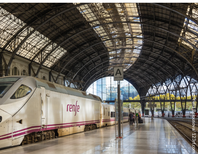
▲ ESTACIÓN DE FRANCIA BARCELONA

Ministerio de Industria, Comercio y Turismo Publicado por: © Turespaña Creado por: Lionbridge NIPO: 086-18-005-8