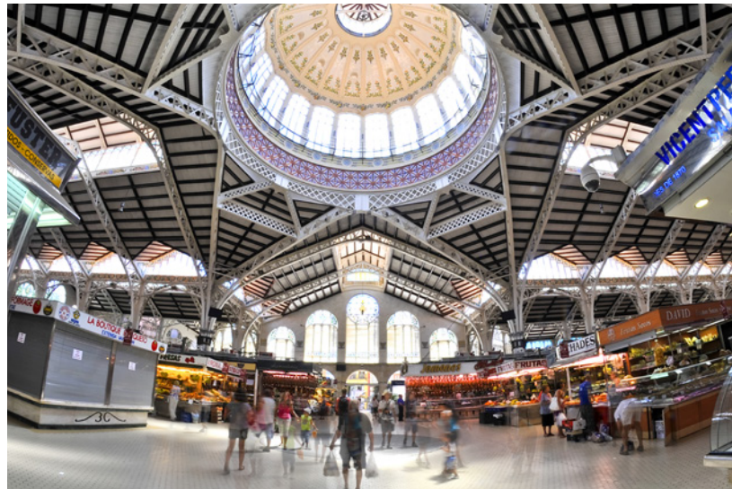
▲ MERCADO CENTRAL

Desfrute de uma das joias de Valência: o bairro de El Cabañal . Vai adorar passear pelas suas casas de fachadas coloridas e cobertas de azulejos e visitar o seu mercado de produtos frescos.