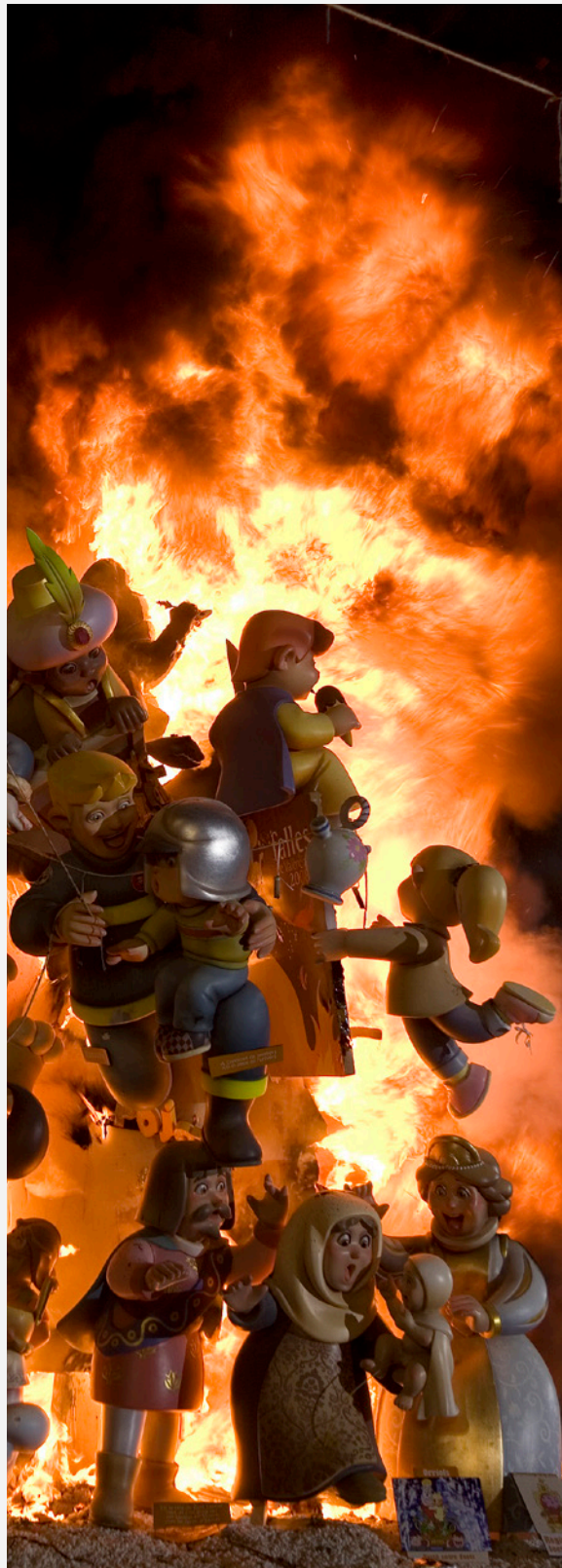
▲ LE FALLAS

Vuoi scoprire il folklore valenciano? Assisti alla tradizionale dansà che si svolge la vigilia della seconda domenica di maggio, in occasione della festa della Virgen de los Desamparados , patrona di Valencia.