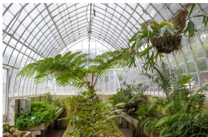
▲ ORTO BOTANICO