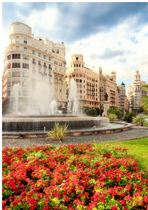
▲ PIAZZA DEL COMUNE

Se ami l'artigianato, visita il mercato di piazza Redonda , nel quartiere di La Xerea , e acquista qualche souvenir.