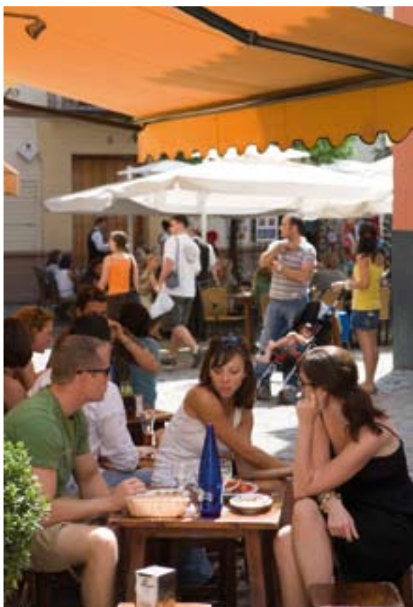
▲ DZIELNICA SANTA CRUZ

Nie ma znaczenia, kiedy zdecydujesz przyjechać do Sewilli. Miasto ma tyle do zaoferowania, że każda pora roku jest dobra, by wyjść na tapas, zobaczyć flamenco na żywo, odbyć rejs po rzece Gwadalkiwir czy poczuć magię Wielkiego Tygodnia.