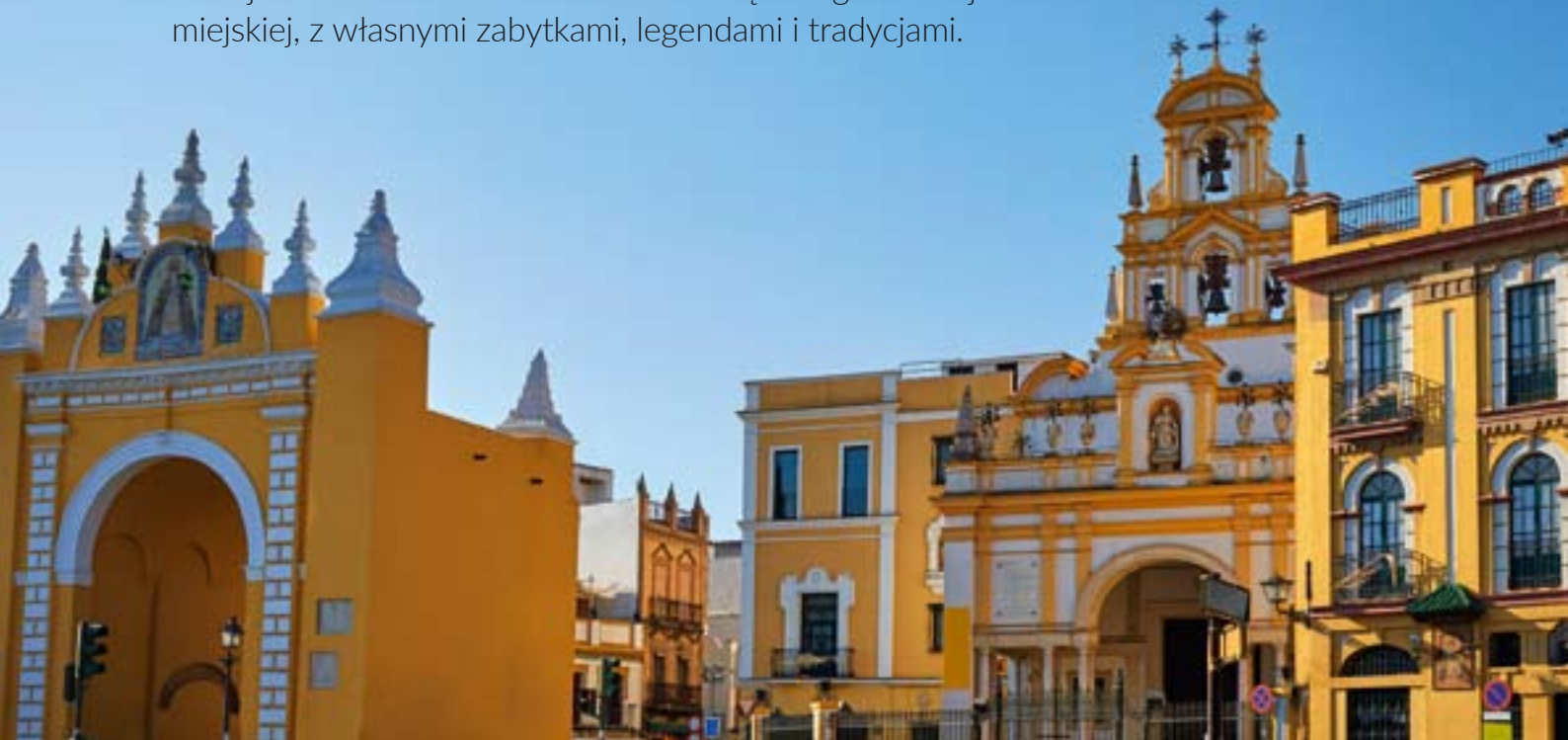
▲ BRAMA I BAZYLIKA LA MACARENA

Położona na północ od zabytkowego centrum dzielnica Macarena jest jedną z najbardziej tradycyjnych w Sewilli. Jest jak oddzielne miasteczko wewnątrz aglomeracji miejskiej, z własnymi zabytkami, legendami i tradycjami.