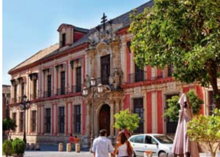
▲ PAŁAC ARCYBISKUPA

W programie spaceru po centrum nie może zabraknąć wizyty na ulicy Sierpes . To tętniący życiem deptak, chętnie odwiedzany przez mieszkańców Sewilli