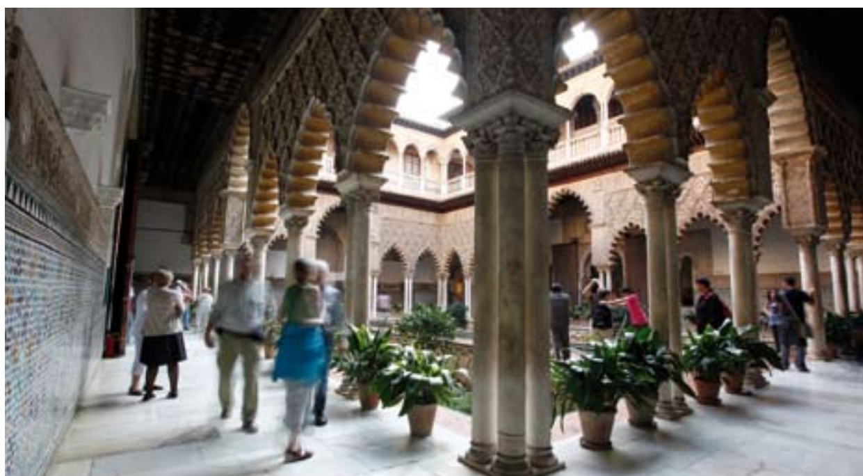
▲ ALKAZAR W SEWILLI

Sewilla wyróżnia się ciekawymi, niezwykłymi dzielnicami, jak na przykład leżąca w samym centrum Santa Cruz , z urokliwymi uliczkami, pałacami i ukwieconymi patiami, albo dzielnica Triana , po drugiej stronie rzeki Gwadalkiwir, o morskim charakterze i słynna dzięki flamenco, lub tradycyjna i pełna historii dzielnica Macarena .