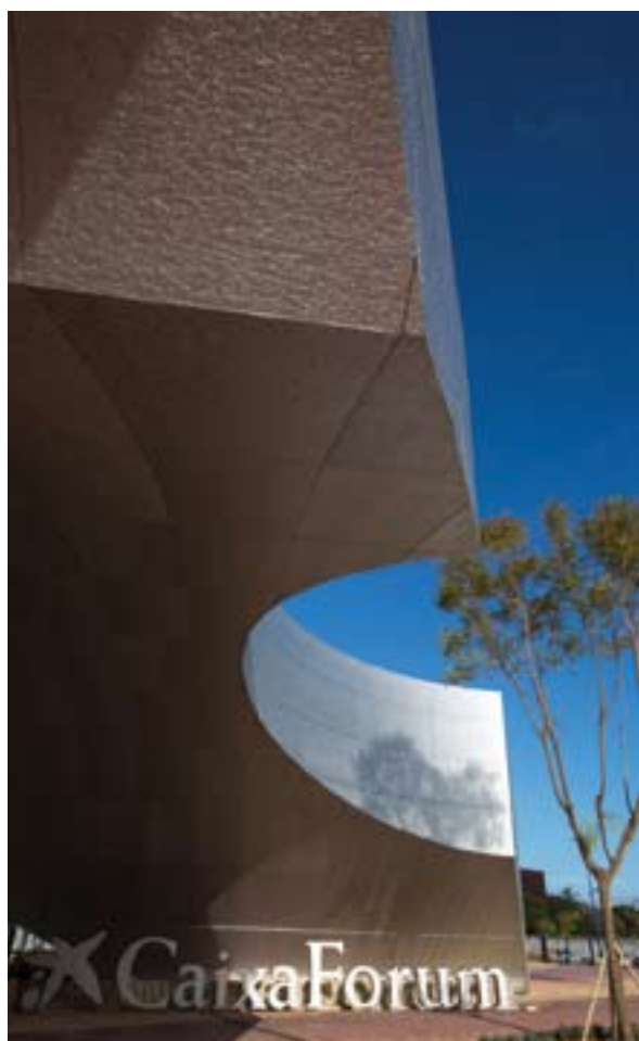
▲ CAIXA FORUM