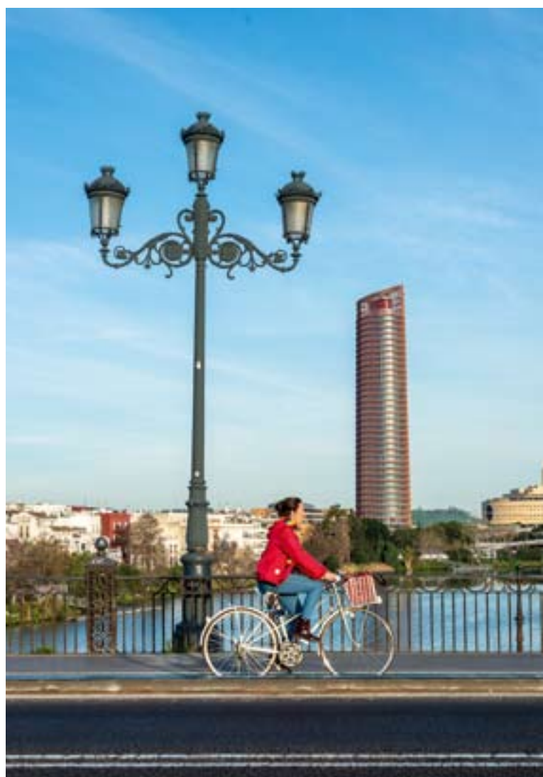
▲ WIEŻOWIEC TORRE SEVILLA ZDJĘCIE: BIURO DS. TURYSTYKI SEWILLI

Sewilla ma kilka punktów widokowych, które na pewno ci się spodobają. Wjedź na szczyt Torre Sevilla , najwyższego wieżowca nie tylko w Sewilli, ale i w całej Andaluzji, liczącego 180 metrów wysokości. Podziwiał także niesamowite panoramiczne widoki z Wieży Schindlera (Torre Schindler), która stoi nad samą rzeką Gwadalkiwir.