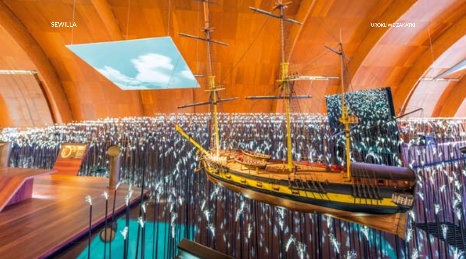
▲ PAWILON ŻEGLUGI

Warto też odwiedzić Pawilon Żeglugi ( Pabellón de la Navegación ) na Wyspie Kartuzów (Isla de la Cartuja) – centrum poświęcone historii żeglugi morskiej. Znajduje się ono nad brzegiem rzeki Gwadalkiwir, w pobliżu starego miasta i przedstawia Sewillę jako port oraz punkt startowy wypraw i podboju Nowego Świata.