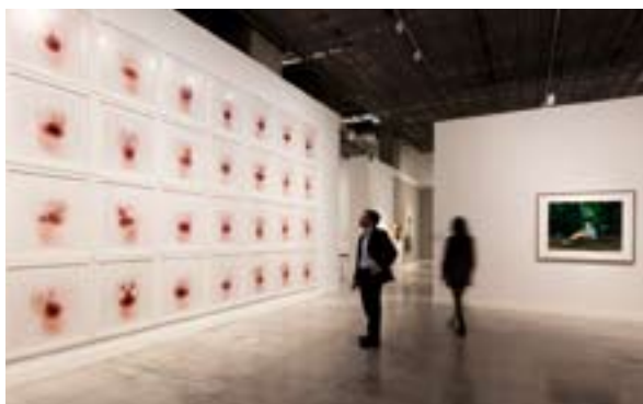
▲ CAIXA FORUM

Odwiedź Andaluzyjskie Centrum Sztuki Współczesnej (Centro Andaluz de Arte Contemporáneo), mieszczące się w dawnym klasztorze kartuzów La Cartuja. Znajdziesz tam kolekcję sztuki, która obejmuje prace od drugiej połowy XX wieku do współczesności i stanowi przegląd pojawiających się w tym czasie w Hiszpanii trendów artystycznych. Skorzystaj z okazji, aby poznać wszystkie atrakcje centrum, w tym także jego ważne dziedzictwo archeologiczne.