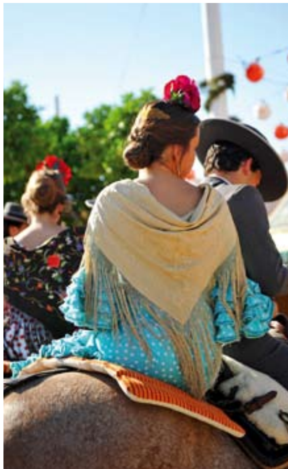
▲ FESTYN FERIA DE ABRIL, SEWILLA

Jesteś sportowcem? Dołącz do sewilczyków uprawiających modne wśród nich wioślarstwo . Na rzece Gwadalkiwir o każdej porze dnia spotkać można ludzi smagających wodę wiosłami. Możesz skorzystać z oferty wycieczek kajakowych z przewodnikiem , również w języku angielskim. Daje to możliwość dodatkowego, bo z perspektywy rzeki, podziwiania takich zabytków jak Torre del Oro (Złota Wieża), La Maestranza (arena walki byków) czy klasztor kartuzów La Cartuja.