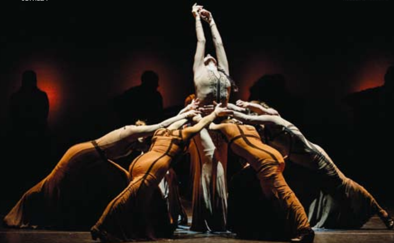
▲ BIENNALE FLAMENCO