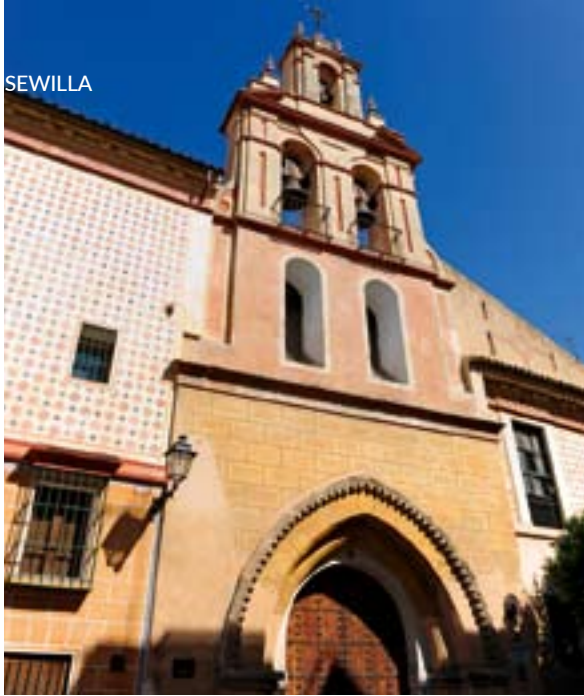
▲ KOŚCIÓŁ SANTA MARÍA LA BLANCA SEWILLA

A może chcesz wiedzieć, dlaczego na dziedzińcu drzew pomarańczowych (Patio de los Naranjos) katedry w Sewilli znajduje się krokodyl? Najlepiej sprawdź to osobiście. Możesz także zgłębić arabską tradycję Sewilli, która przez ponad pięć wieków była miastem muzułmańskim o nazwie Isbiliya. Na szlaku dziedzictwa islamskiego odwiedź meczety, pałace czy łaźnie arabskie. Opracuj własny plan wycieczki, by poznać tamtą minioną epokę.