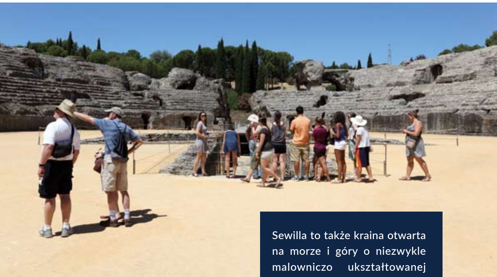
▲ KOMPLEKS ARCHEOLOGICZNY ITÁLICA, SANTIPONCE

Sewilla to także kraina otwarta na morze i góry o niezwykle malowniczo ukształtowanej powierzchni terenu, mająca wiele do zaoferowania odwiedzającym ją turystom.