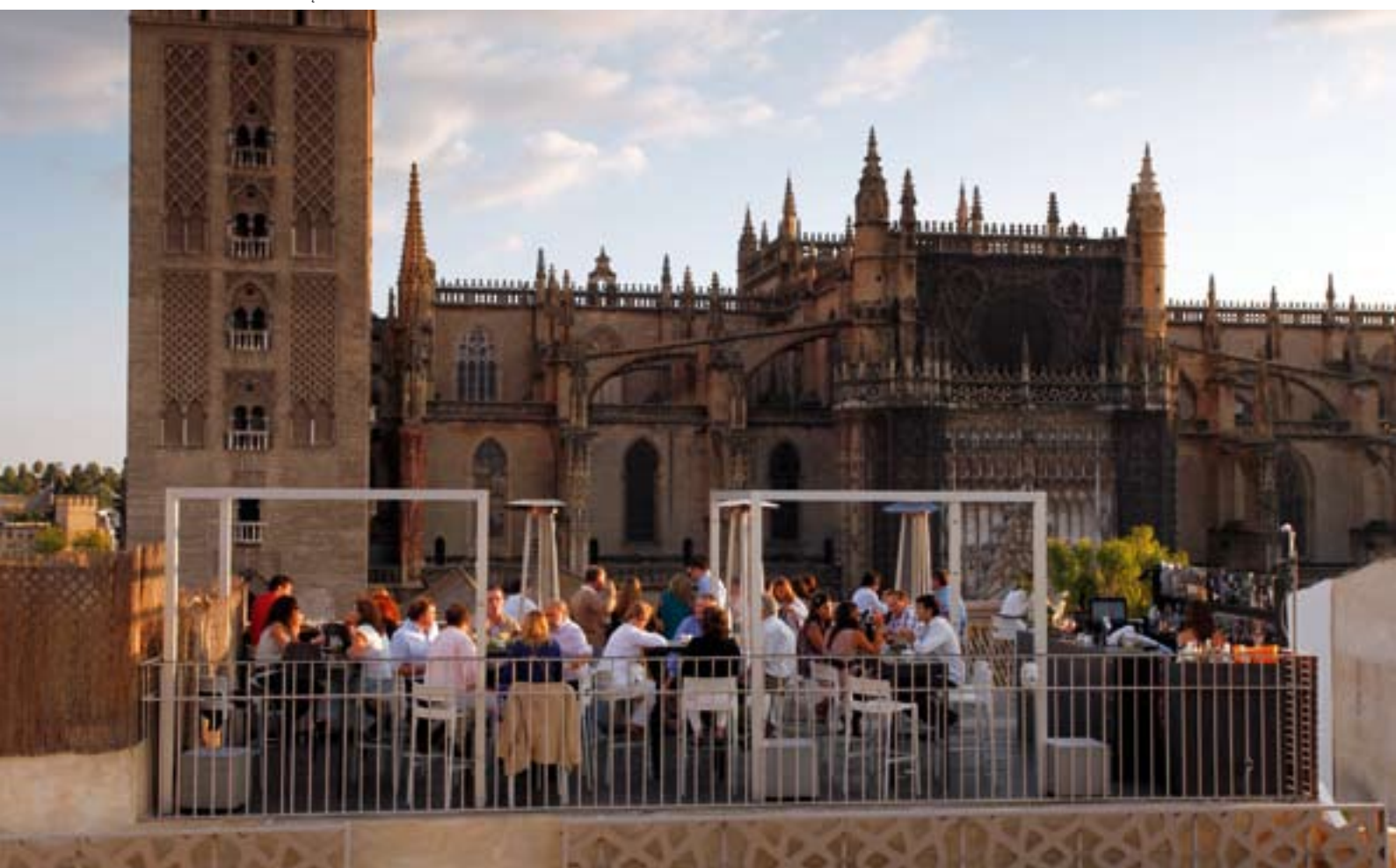
▼ TARAS Z WIDOKIEM NA GIRALDĘ

Odpuść i zrelaksuj się na tarasach ze wspaniałymi widokami na miasto. W historycznym centrum oraz dzielnicy Triana znaleźć można wiele lokali z takimi tarasami na dachach domów, oferujących najlepszą kuchnię andaluzyjską oraz spektakle i muzykę na żywo pod gołym sewilskim niebem. Ciesz się chwilą, atmosferą, cudowną panoramą na miasto i malowniczym zachodem słońca nad rzeką Gwadalkiwir.