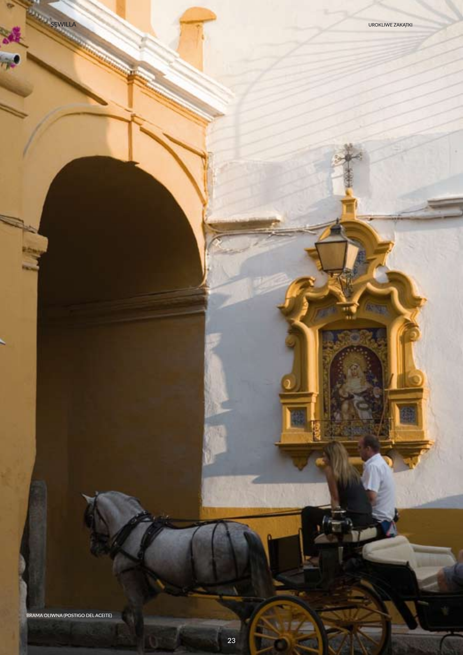
BRAMA OLIWNA (POSTIGO DEL ACEITE)