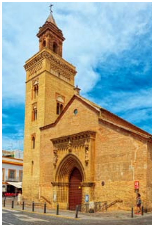
▲ KOŚCIÓŁ ŚW. MARKA

Prawdziwym sercem dzielnicy Macarena jest ulica San Luis , usiana barami, sklepami i przytulnymi restauracjami, w których warto popróbować lokalnej kuchni. Są tu też takie skarby architektury jak kościół Santa Marina , jeden z najstarszych w mieście i reprezentujący styl gotyku-mudéjar lub kościół św. Marka (San Marcos), jeden z najlepiej zachowanych XIV-wiecznych kościołów parafialnych, pomimo późniejszych pożarów i trzęsień ziemi.