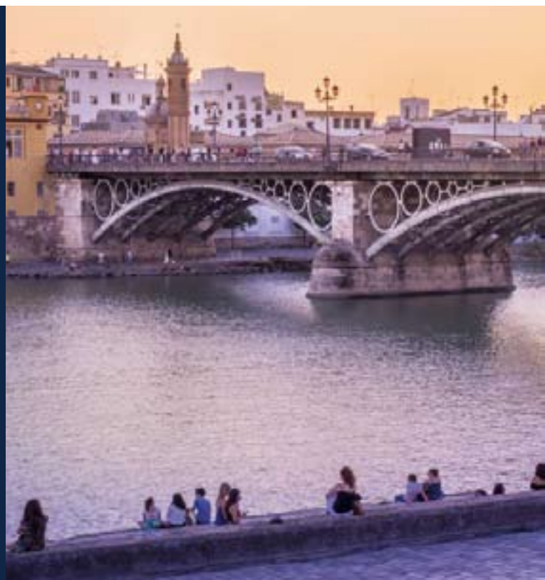
▲ MOST IZABELI II

W Trianie znajdziesz również perły architektury, takie jak callejón de la Inquisición czyli zaułek Inkwizycji, w którym zachowały się pozostałości dawnego zamku św. Jerzego (San Jorge).