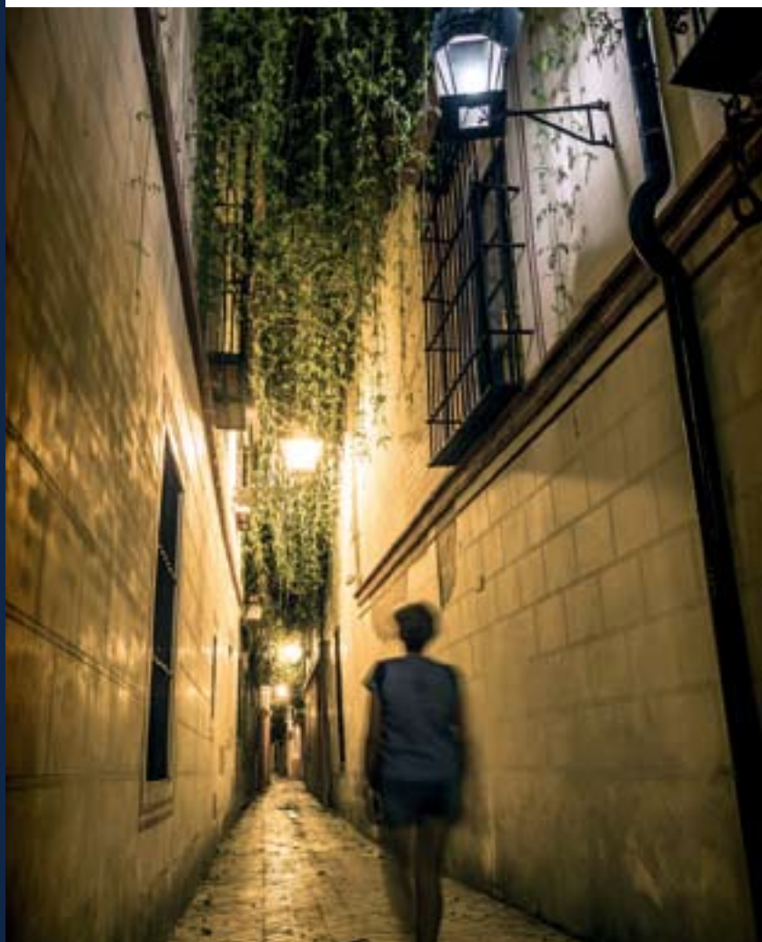
▲ DZIELNICA SANTA CRUZ

Pałac Miguel de Mañara to kolejna monumentalna budowla, która od 1623 roku służyła jako arystokratyczna rezydencja. Natomiast kościół Santa María la Blanca , zbudowany na miejscu XIII-wiecznej synagogi, zachowuje do dziś jej oryginalną strukturę, chociaż był dwukrotnie odbudowywany: pierwszy raz w XIV wieku, a później, w XVII wieku, przekształcony został w jedną z najbardziej reprezentatywnych świątyń barokowych Sewilli.