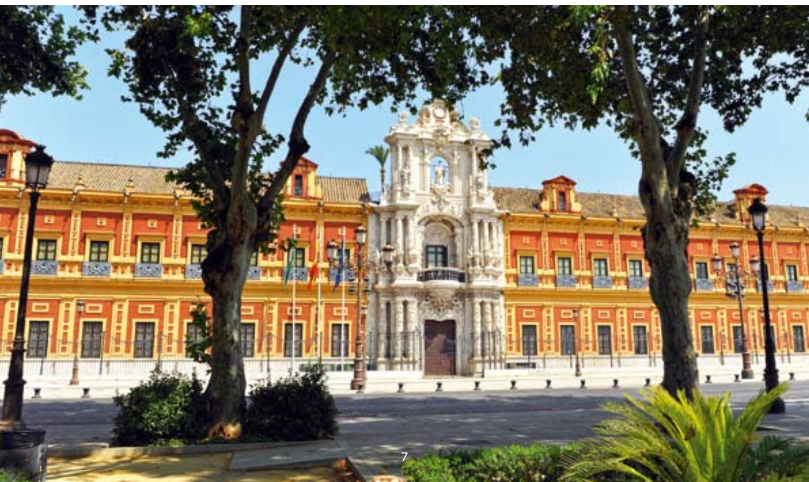
▼ PAŁAC SAN TELMO

Poświęć trochę więcej czasu na spacer po placu-ogrodzie Alameda de Hércules (Promenada Herkulesa). To alternatywna przestrzeń par excellence Sewilli, gdzie znaleźć można niemal wszystko – niezwykle zabytki, bogatą ofertę kulturalną i życie nocne. Jest tu mnóstwo barów z muzyką na żywo oraz miejsc z muzyką elektroniczną.