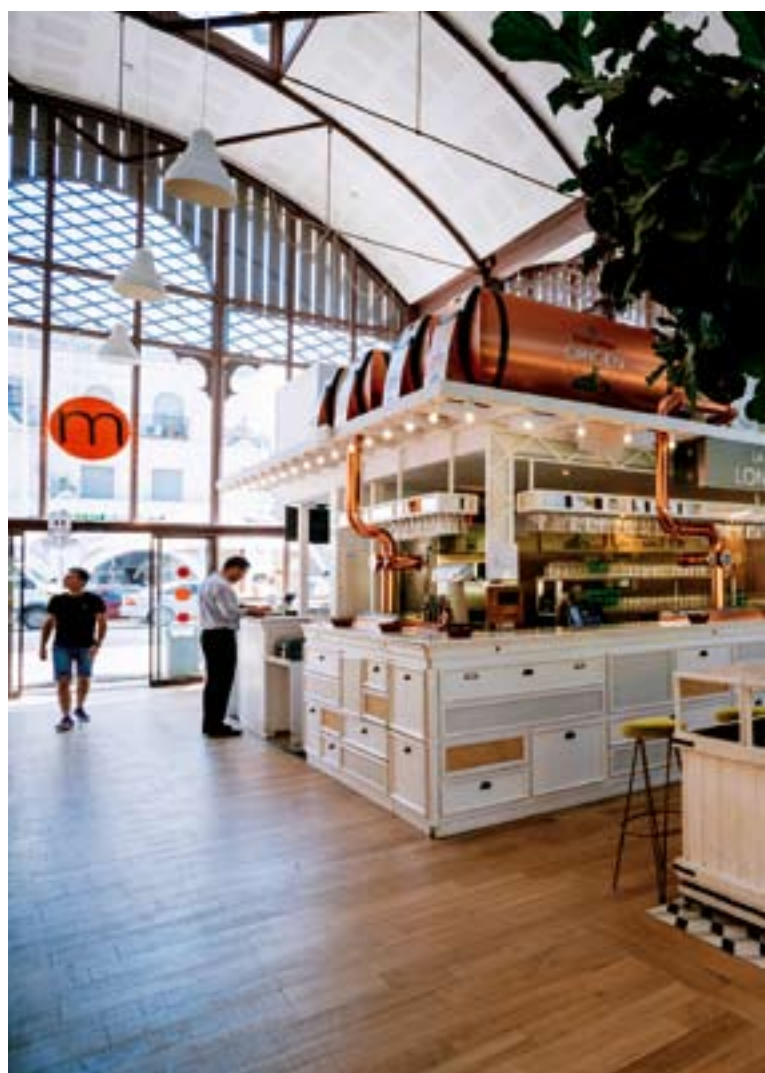
▲ HALA TARGOWA LONJA DEL BARRANCO

Więcej informacji na stronie: www.mercadolonjadelbarranco.es