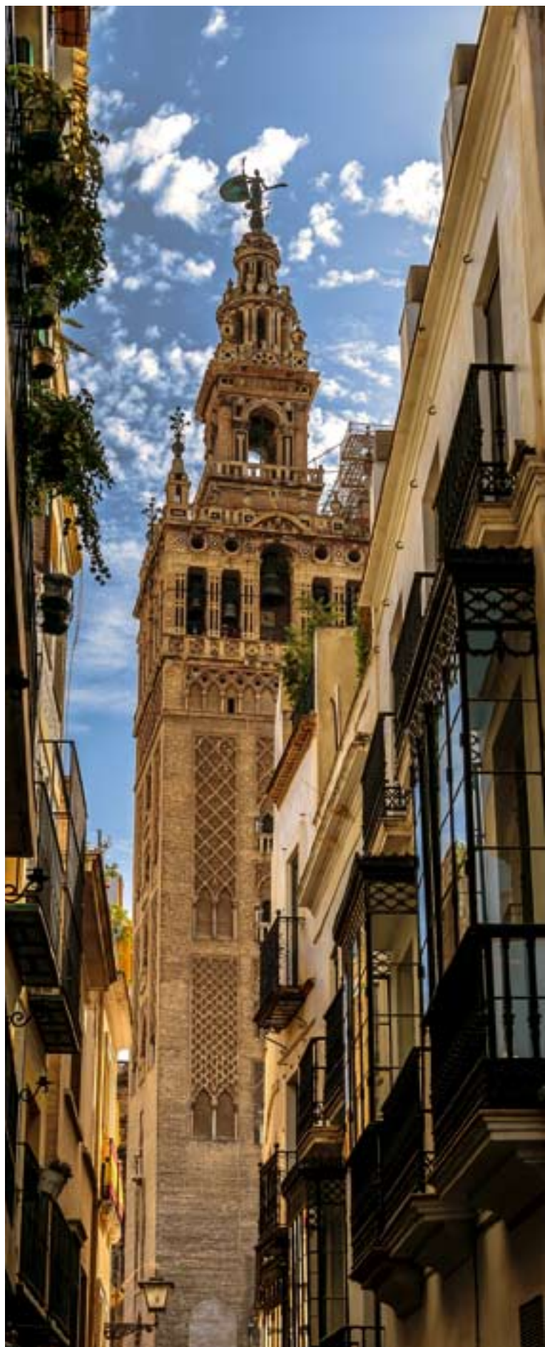
▲ WIEŻA GIRALDA

Ciesz się smakami miasta, kosztując różnorodnych smacznych tapas w barach w jego zabytkowej dzielnicy. Ulice Sewilli to bijące serce miasta, a spacerując po nich czy przysiadając w jednym z wielu ogródków gastronomicznych, by podziwiać widoki na symbole tego miasta jak katedra i Giralda , poczujesz przyływ życiowej energii.