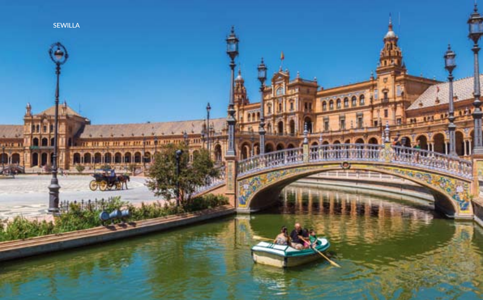
▲ PLAC HISZPAŃSKI

Innym ważnym punktem programu zwiedzania, którego nie wolno pominąć, jest Plac Hiszpański – niezwykle zespół architektoniczny w parku Marii Luizy . Został zaprojektowany i zbudowany na Wystawę Iberoamerykańską w 1929 roku. Główny budynek ma półkolisty kształt, a jego boki przypominają ramiona, którymi Hiszpania w symboliczny sposób obejmuje swoje dawne zamorskie terytoria. Budynek skierowany jest w stronę rzeki Gwadalkiwir, wskazując tym samym drogę do Nowego Świata. To wyjątkowe miejsce zostało wybrane jako sceneria do tak znanych filmów jak Lawrence z Arabii lub Gwiezdne Wojny, odcinek II. Atak klonów .