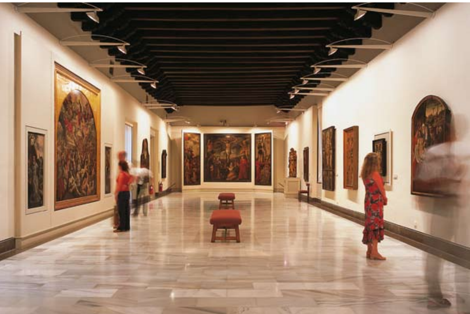
▲ MUZEUM SZTUK PIĘKNYCH

Sewilla to miasto, gdzie na przestrzeni wieków pojawiały się i znikwały różne cywilizacje, kultury i style artystyczne. Poznaj je w muzeach, teatrach i centrach kultury.