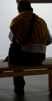
俄罗斯圣彼得堡博物馆的展品