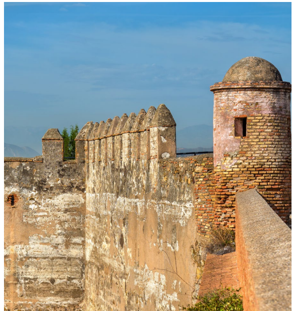
▲ 希布拉尔法罗城堡

想要沉醉于这座城市从古罗马时期到当今的历史，那就跟随马拉加历史古迹线路游览。在线路的末尾，别忘了参观一下希布拉尔法罗 (Gibralfaro) 城堡。