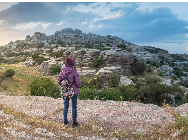
▲ 安特克拉的托尔卡尔山

马拉加的冬天因为杏花的开放被装点得色彩缤纷。卡萨韦尔梅哈 (Casabermeja)、阿雷纳斯 (Arenas)、阿尔达莱斯 (Ardales)、卡拉特拉卡 (Carratraca)、阿尔莫希亚 (Almogía)、佩里亚纳 (Periana) 或瓜罗 (Guaro) 地区都开满了白色和蔷薇色的杏花。