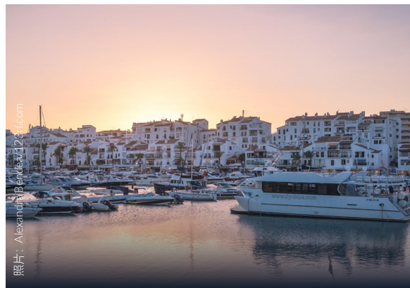
▲ 巴努斯港 玛维亚

深达 150 米的峡谷将城市一分为二，一定会让你大为震惊。你还会看到穿过峡谷的三座桥：最有名的是建于十三世纪的新桥。到老城区转转，这里独具中世纪风格，又融入了阿拉伯文化的影响。