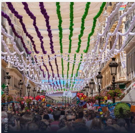
▲ FIERA DI MALAGA

Molteplici attività ti aspettano alla Feria di Malaga. In estate potrai partecipare a tantissimi festival musicali: il Festival Oh, see!, il Festival Internazionale di Musica da Camera "Málaga Clásica", il Festival Terral, il Brisa Festival e il Sabàtic Fest. Se sei appassionato di moda non farti sfuggire la Larios Malaga Fashion Week , una serie di sfilate che si susseguono su una passerella all'aperto lunga più di 300 metri.