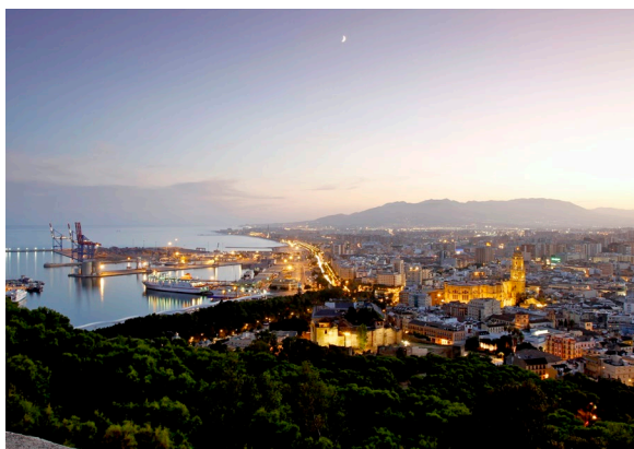
▲ VEDUTA AEREA DI MALAGA

MUSEO PICASSO DI MALAGA