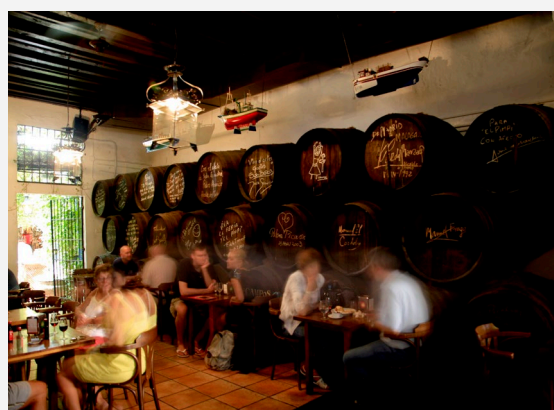
▲ BODEGA EL PIMPI

Percorri le vie comprese tra piazza della Merced e piazza della Constitución , una delle zone di vita notturna più vivaci. Se preferisci posti più rilassanti, visita La Malagueta , il molo 1 o il lungomare di Pedregalejo .