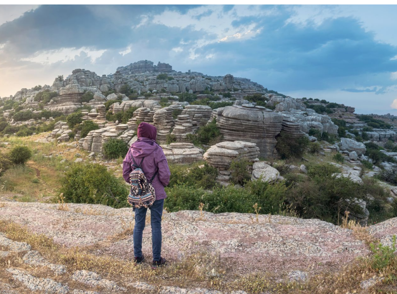
▲ TORCAL DE ANTEQUERA

Malaga può ben vantare di essere una delle province più montuose della Spagna. Fai trekking in ambienti spettacolari come il Torcal de Antequera, uno scenario naturale con curiose formazioni di rocce carsiche.