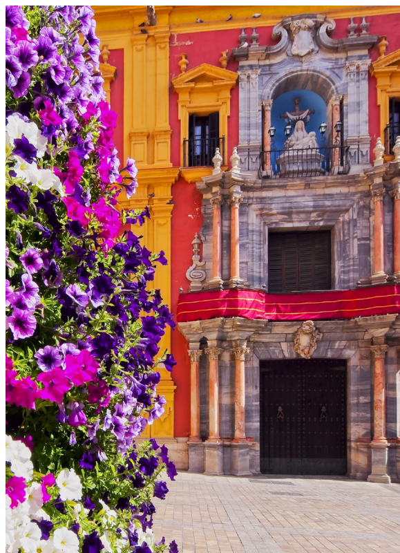
▲ PALAZZO EPISCOPALE

Se ami fare shopping, in via Marqués de Larios troverai i marchi più importanti della moda.