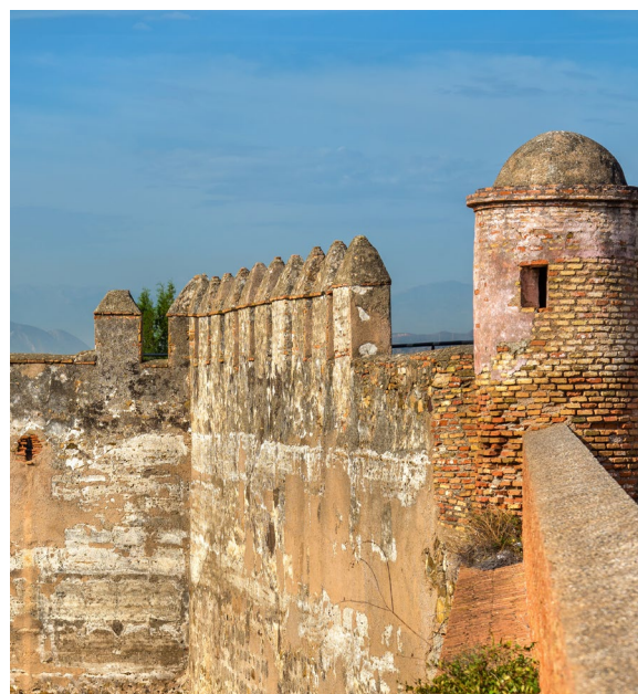
▲ CASTELLO DI GIBRALFARO

Per immergerti nella storia della città dall'epoca romana ai nostri giorni, percorri l'itinerario della Malaga monumentale . Completa il percorso con una visita al Castello di Gibralfaro .