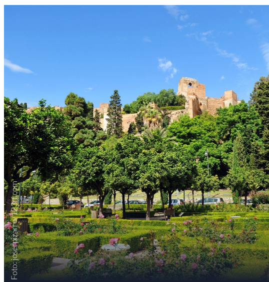
▲ GIARDINI DI PEDRO LUIS ALONSO

I giardini di Pedro Luis Alonso , di impostazione latina con influssi ispano-arabi e francesi, ti aspettano con i loro aranci, i laghetti e un bel rosaio. Nelle vicinanze, sul versante meridionale del monte Gibralfaro, troverai i giardini di Puerta Oscura , dove la vegetazione si armonizza con la presenza di fontane, viali, piazzette e terrazze.