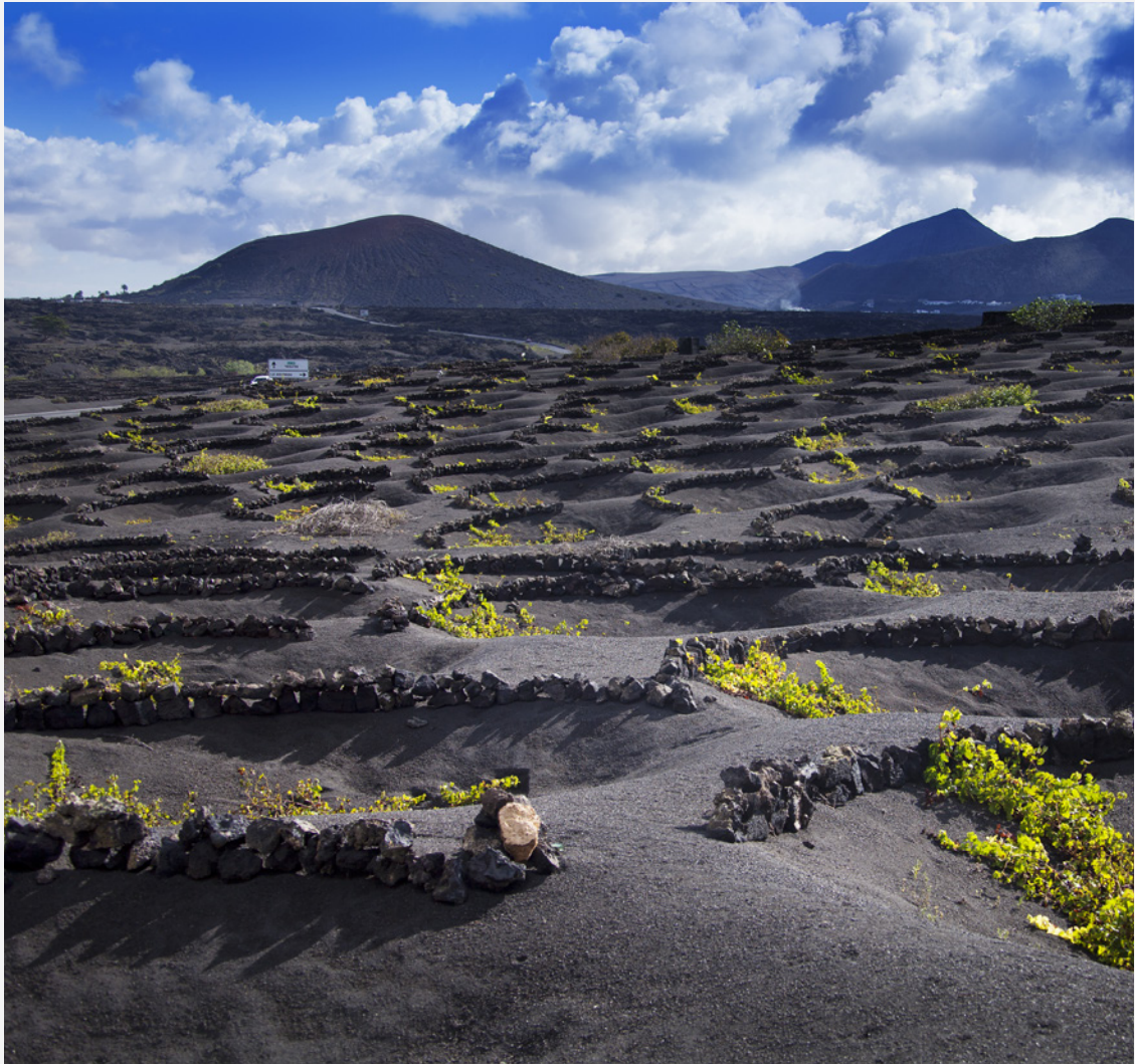
▲ LA GERIA LANZAROTE

Sur les îles fortunées vous savourez de délicieux poissons et fruits de mer , comme la vieja (poisson-perroquet méditerranéen), le mérrou ou le cernier commun. Les Canaries sont aussi un éden fruitier, où la banane occupe la première place. Savourez les 10 vins d'appellation d'origine produits sur l'archipel et goûtez les différents fromages , notamment le majorero , un bijou culinaire de Fuerteventura élaboré avec du lait de