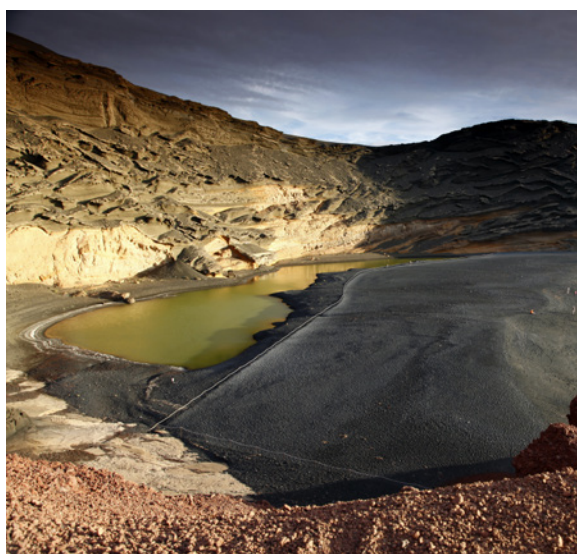
▲ CHARCO DE LOS CLICOS LANZAROTE

Explorez la lagune de Janubio et grimpez au belvédère pour contempler les salines. Au Charco de los Clicos , réserve de la biosphère, vous découvrirez un incroyable lac vert sur un cratère volcanique.