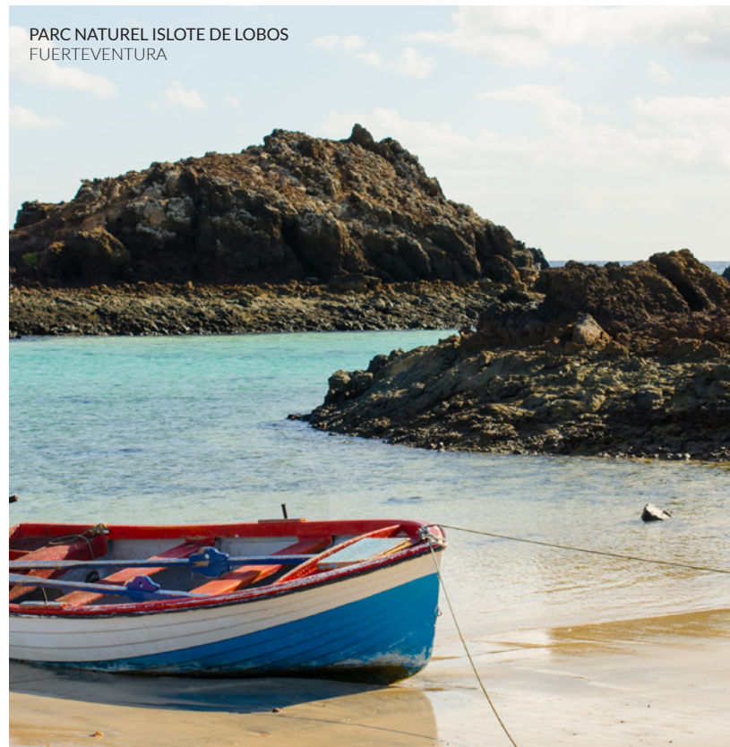
PARC NATUREL ISLOTE DE LOBOS FUERTEVENTURA

Au large, les vents et les vagues de Fuerteventura sont parfaits pour s'entraîner à la planche à voile. La plongée se pratique à tous les niveaux, notamment sur les plages de la péninsule de Jandía et à la Caleta de Fuste . Voile, surf, ski nautique ou pêche sont d'autres sports possibles ici (si vous aimez les sensations fortes, osez la pêche au marlin).