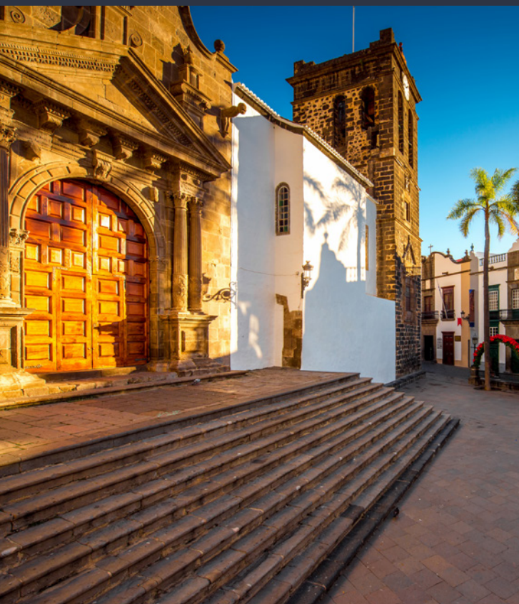
▲ ÉGLISE EL SALVADOR SANTA CRUZ DE LA PALMA

La « isla bonita » (la belle île) est la plus verte de l'archipel. Elle vaut la peine d'être visitée, rien que pour ses bois préhistoriques de « laurisilva » et pour ses conditions astronomiques, qui permettent d'observer les étoiles sous l'un des plus beaux ciels du monde. Classée réserve de la biosphère dans sa totalité, il y a plusieurs manières de la parcourir, mais le mieux est de le faire à pied. Ses sentiers sont conçus pour tous les aventuriers et vous mèneront à des endroits incroyables.