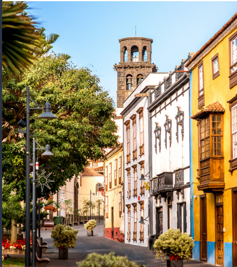
▲ SAN CRISTÓBAL DE LA LAGUNA TENERIFE

Sur la côte et à l'intérieur de l'île, vous trouverez de jolis villages et fermes entourés du calme des montagnes où sont encore bien vivantes les traditions locales. Le sud est particulièrement célèbre pour ses grands resorts de vacances, ses parcs thématiques et sa vie nocturne animée. Son carnaval est également célèbre, c'est une véritable explosion de paillettes, de couleurs et de musique.