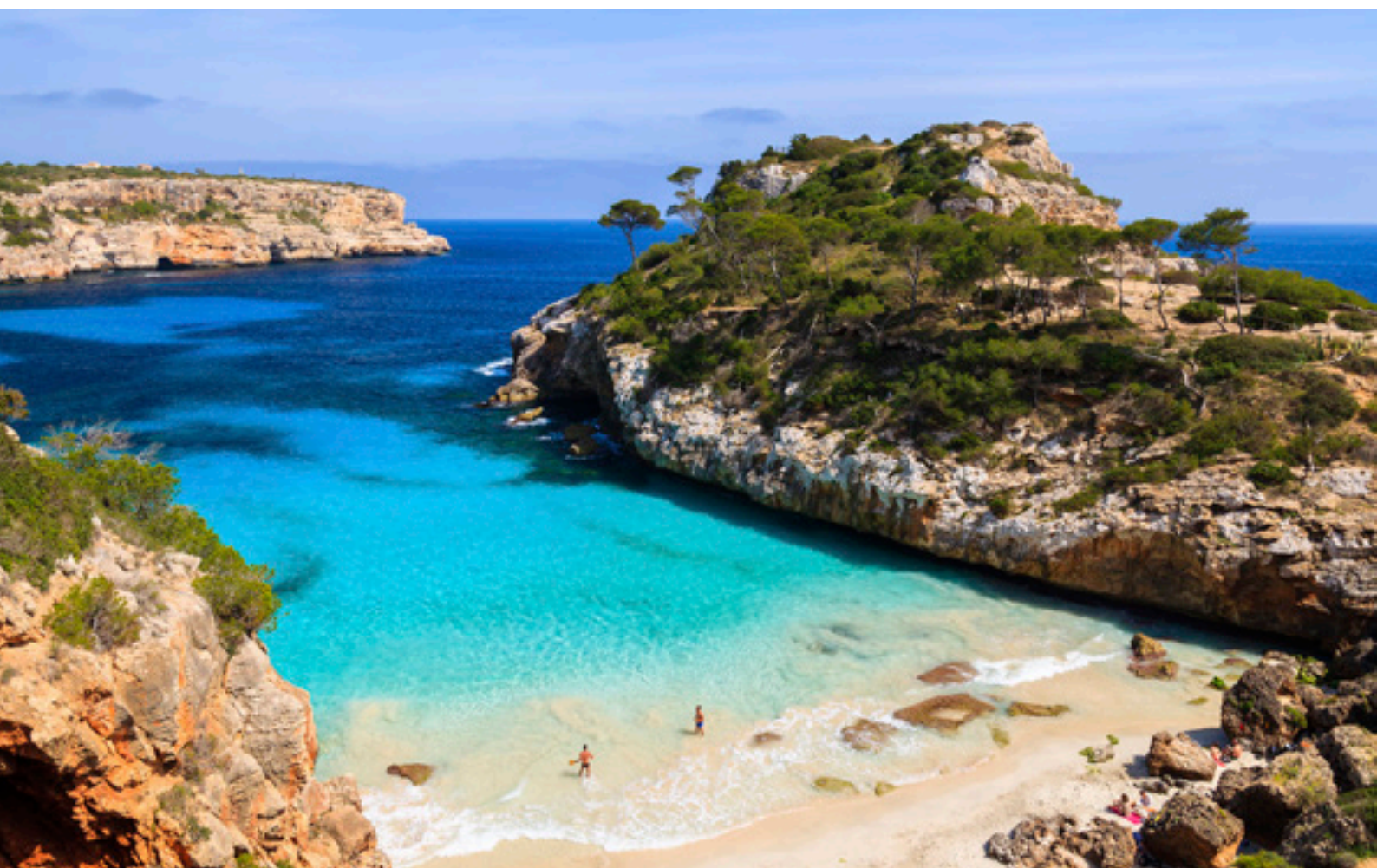
▲ CALÒ DES MORO MAIORCA

Falésias espetaculares, praias virgens enormes, enseadas encantadoras... Encontra a tua praia preferida nas Ilhas Baleares e desfruta de umas férias de sonho nas suas águas cristalinas. Aqui tens uma pequena seleção de dez recantos idílicos.