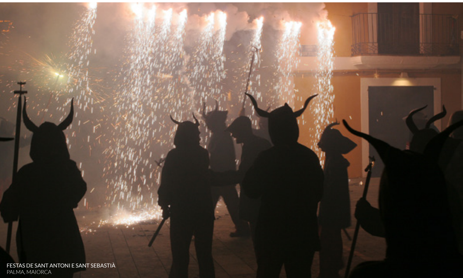
FESTAS DE SANT ANTONI E SANT SEBASTIÀ PALMA, MAIORCA