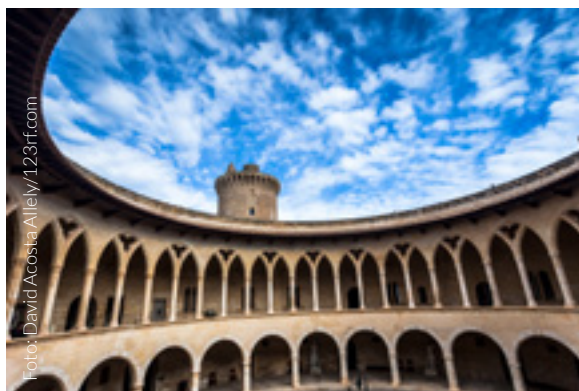
▲ CASTELO DE BELLVER, PALMA MAIORCA

Se queres contemplar a ilha desde um lugar privilegiado, a uns três quilómetros do centro histórico vais encontrar o castelo de Bellver , de estilo gótico, um dos poucos na Europa com uma planta circular.