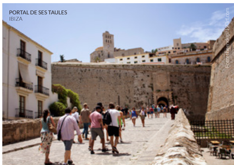
PORTAL DE SES TAULES IBIZA

Junta-te ao turismo criativo, uma nova tendência que se estende por diversas cidades do mundo: participa em atividades interessantes, como workshops de música, dança, fotografia, idiomas ou culinária.