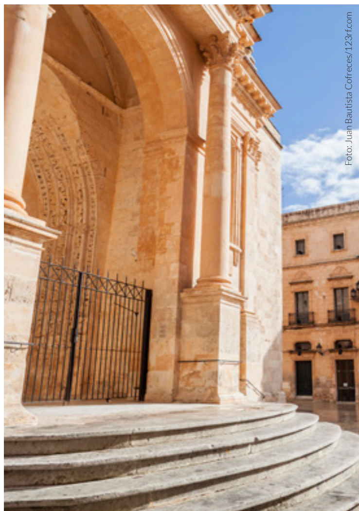
▲ CATEDRAL DE SANTA MARÍA CIUTADELLA, MENORCA

Nos arredores encontrarás monumentos megalíticos que evidenciam as suas origens pré-históricas. Visita a Naveta des Tudons , túmulo coletivo da Idade do Bronze, um dos edifícios mais antigos da Europa.