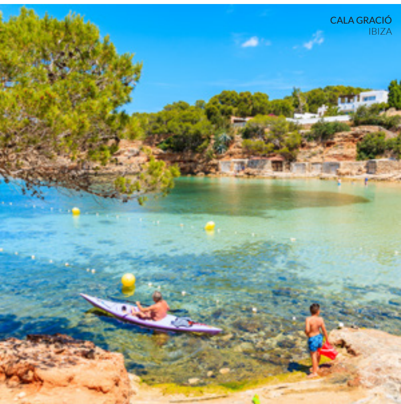
CALA GRACIÓ IBIZA