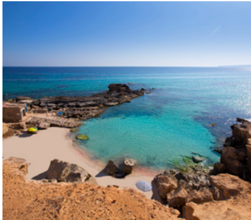
▲ CALÒ D'ES MORT FORMENTERA

A opção perfeita para quem faz nudismo. Tem uns 300 metros de largura e está junto a uma falésia. Podes aproveitar para tomar um banho de lama, como se estivesses num spa.