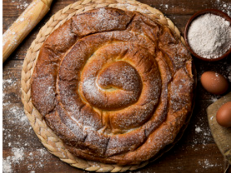
▲ ENSAIMADA MAIORCA

Além disso, são de mencionar os artigos em pele , como o calçado, reconhecido internacionalmente pela qualidade. Se queres conhecer o processo de criação artesanal, podes ir até um dos locais onde o confeccionam, como Inca, na Comarca del Raiguer, no centro da ilha, onde poderás visitar uma das suas fábricas.