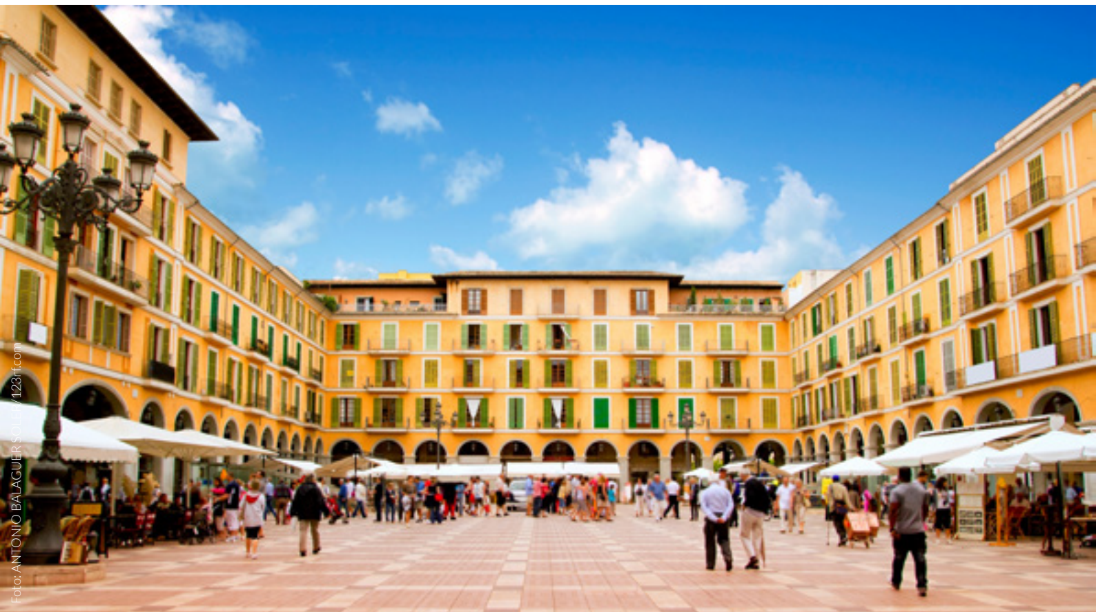
▲ PLAZA MAYOR, PALMA MAIORCA

Natureza, desporto, praias, aldeias com encanto, grutas subterrâneas, a oferta de lazer mais divertida para as famílias... Maiorca tem muito para te oferecer. Do que é que estás à espera para a visitar?