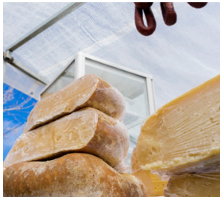
▲ QUEIJO DE MAHÓN MENORCA

No mercado artesanal de Ciutadella , também aberto na época de verão e um dos mais concorridos, vais encontrar de tudo: desde joias e calçado até cerâmica e ilustrações.