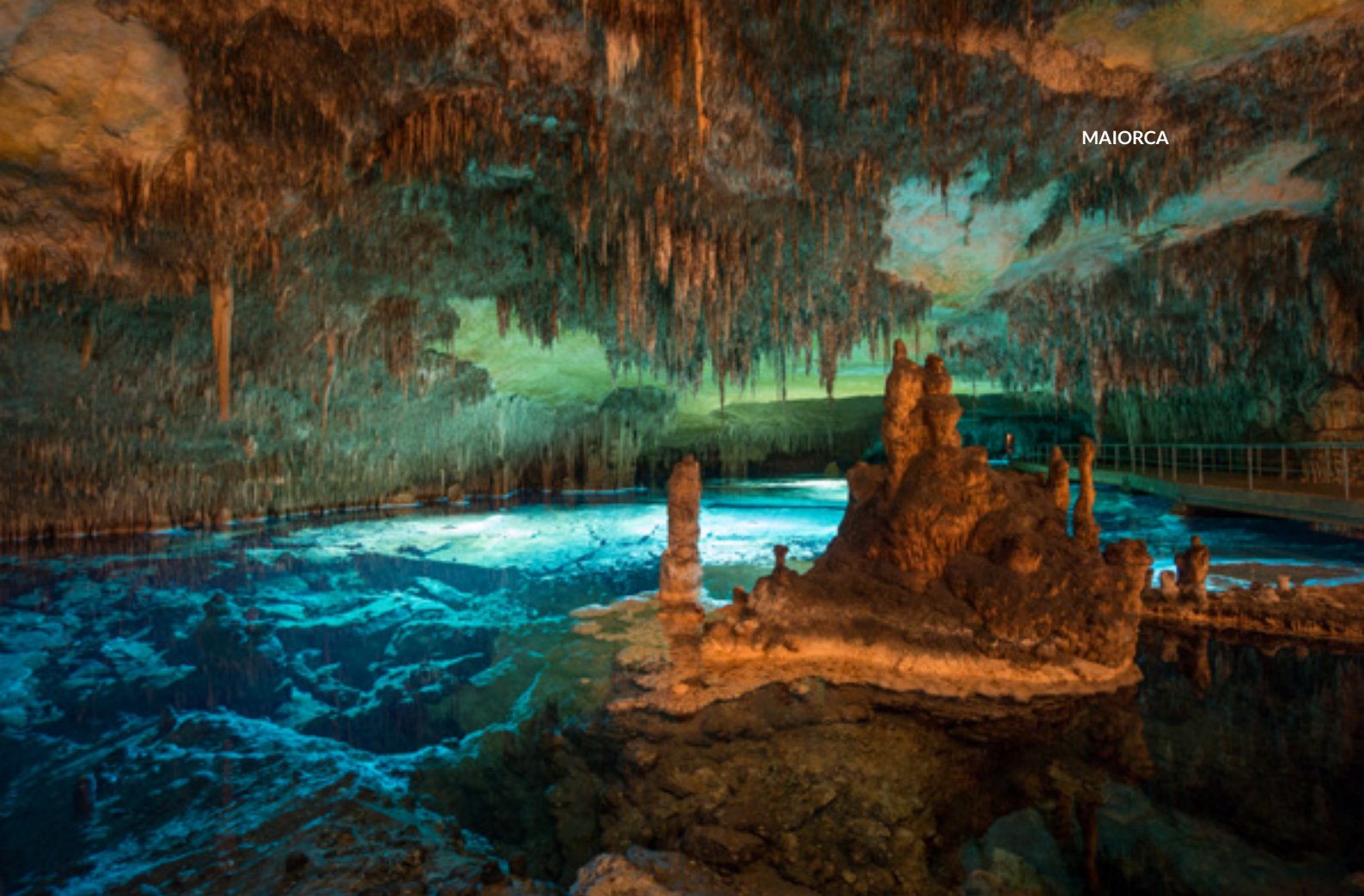
▲ CUEVAS DEL DRACH, PORTO CRISTO MAIORCA