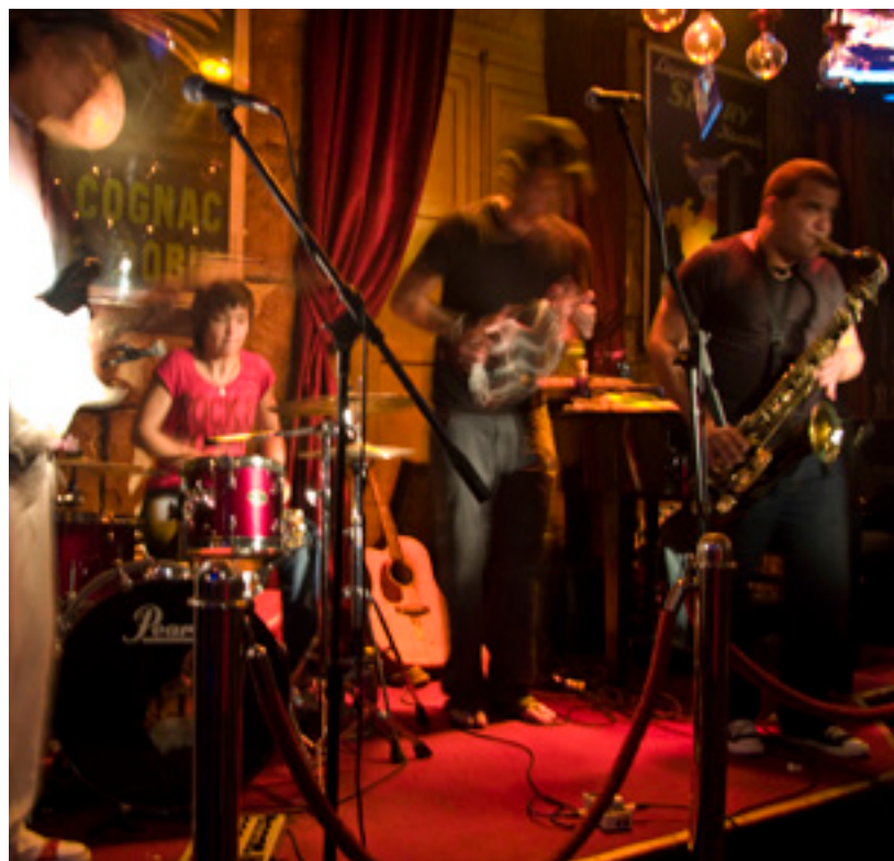
▲ FESTIVAL JAZZ OBERT MENORCA

Durante estes meses, os desportistas têm uma interessante agenda, como Formentera to run , uma corrida de sessenta quilómetros pelos recantos mais bonitos da ilha (finais de maio e princípios de junho). Também podem participar na travessia a nado Formentera-Ibiza Ultraswim , uma travessia de 30 km entre ambas ilhas, combinada com outras duas de 5 km e 750 m, que costuma celebrar-se em maio.