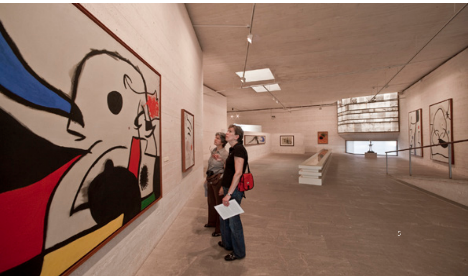
▼ FUNDAÇÃO PILAR E JOAN MIRÓ MAIORCA

Por último, volta à pré-história com os monumentos talaióticos , povoações dos primeiros habitantes do arquipélago. Na localidade de Artà tens à espera um dos maiores e mais bem conservados: Ses Païsses , situado num bonito bosque de azinheiras.