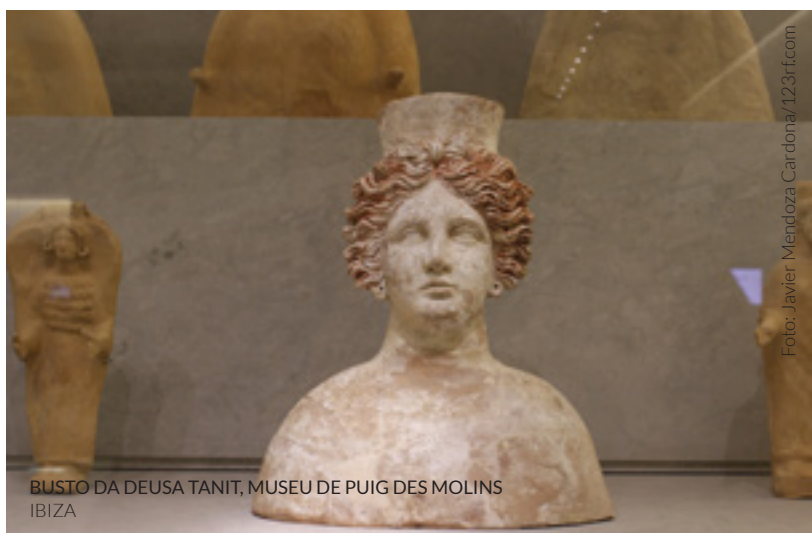
BUSTO DA DEUSA TANIT, MUSEU DE PUIG DES MOLINS IBIZA