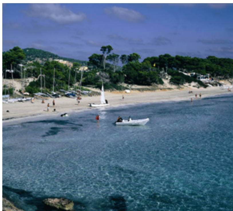
▲ PARQUE NATURAL DE SES SALINES IBIZA

Desde a praia, admira a silhueta dos ilhéus de Es Vedrà e Es Vedranell no parque natural de Cala d'Hort, Cap Llentrisca e Sa Talaia . É uma localização perfeita para praticar mergulho ou percorrer caminhos a pé ou em bicicleta.