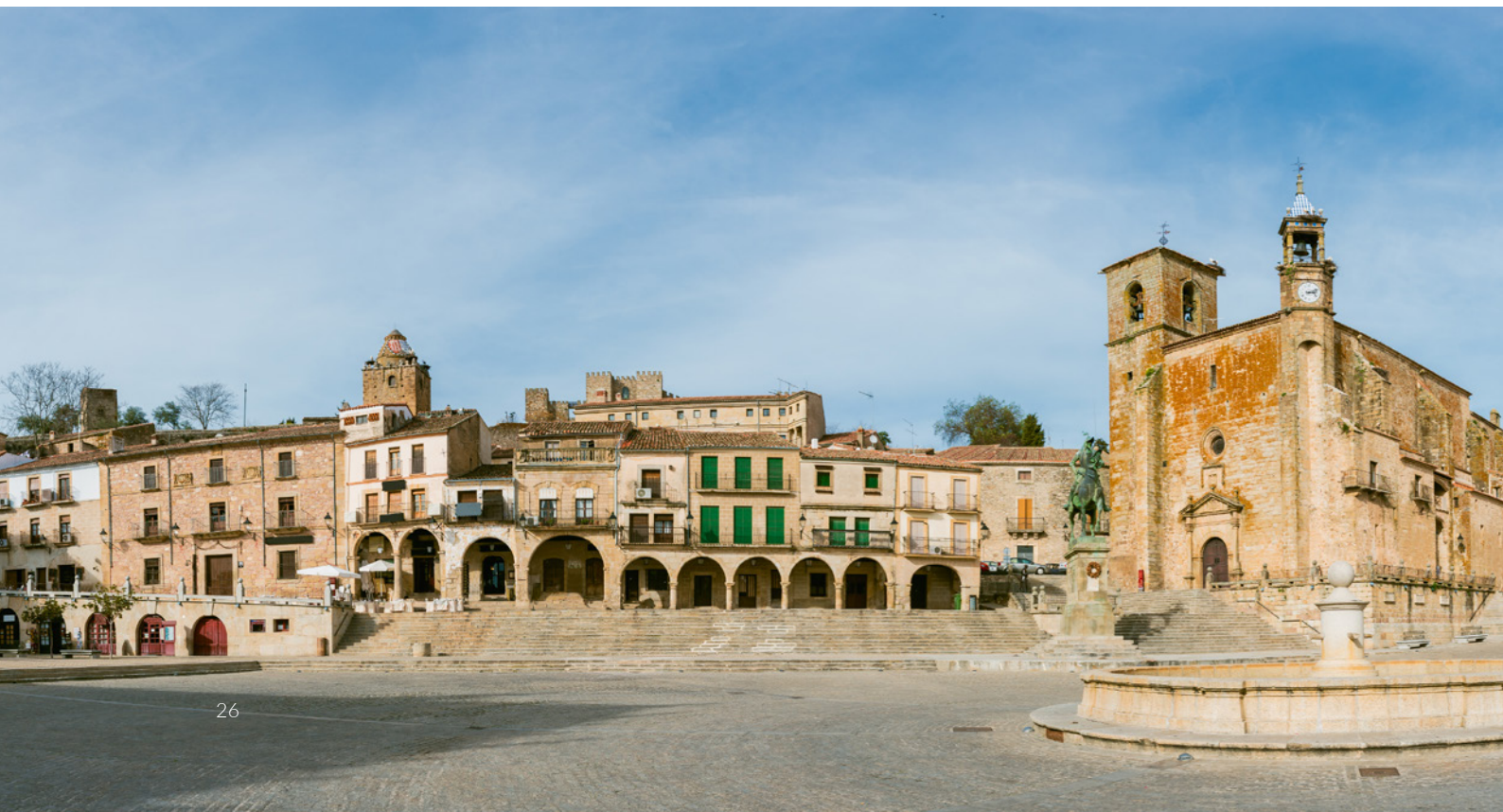
▼ 特鲁希略的马约尔广场 卡塞雷斯

如果你在夏天去阿拉贡地区的 韦斯卡 , 那么千万别错过两个美食节: 7月份举行的 格拉乌斯 (Graus) 腌肉肠日 以及8月举办的 塞尔莱尔 (Cerler) 羊肉节 。