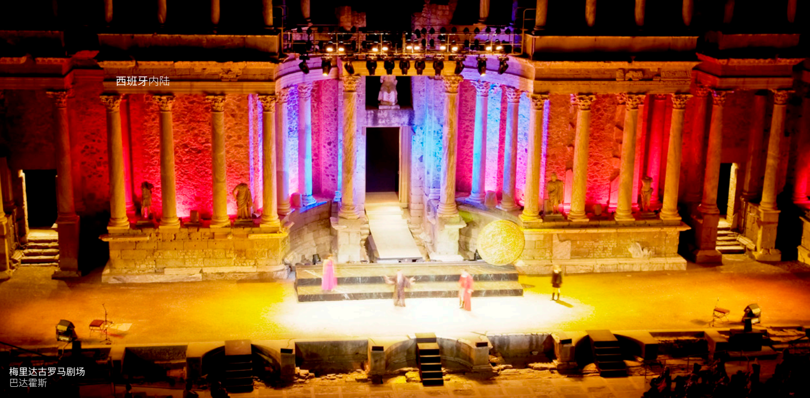
梅里达古罗马剧场 巴达霍斯

如果你喜欢独立音乐，那么就记得预订 Festimad (马德里独立音乐节) 的入场券，该音乐节在4月举办。每年都有当时最受欢迎的乐队前来表演，这里也是新兴乐队崭露头角的舞台。无论你在何时前来马德里，都会爱上这里精彩的文化活动。选择范围非常广，你可以在大型剧院观赏最知名的音乐剧，或者到比如 屠宰场 (Matadero) 这样的前卫艺术中心一探究竟。