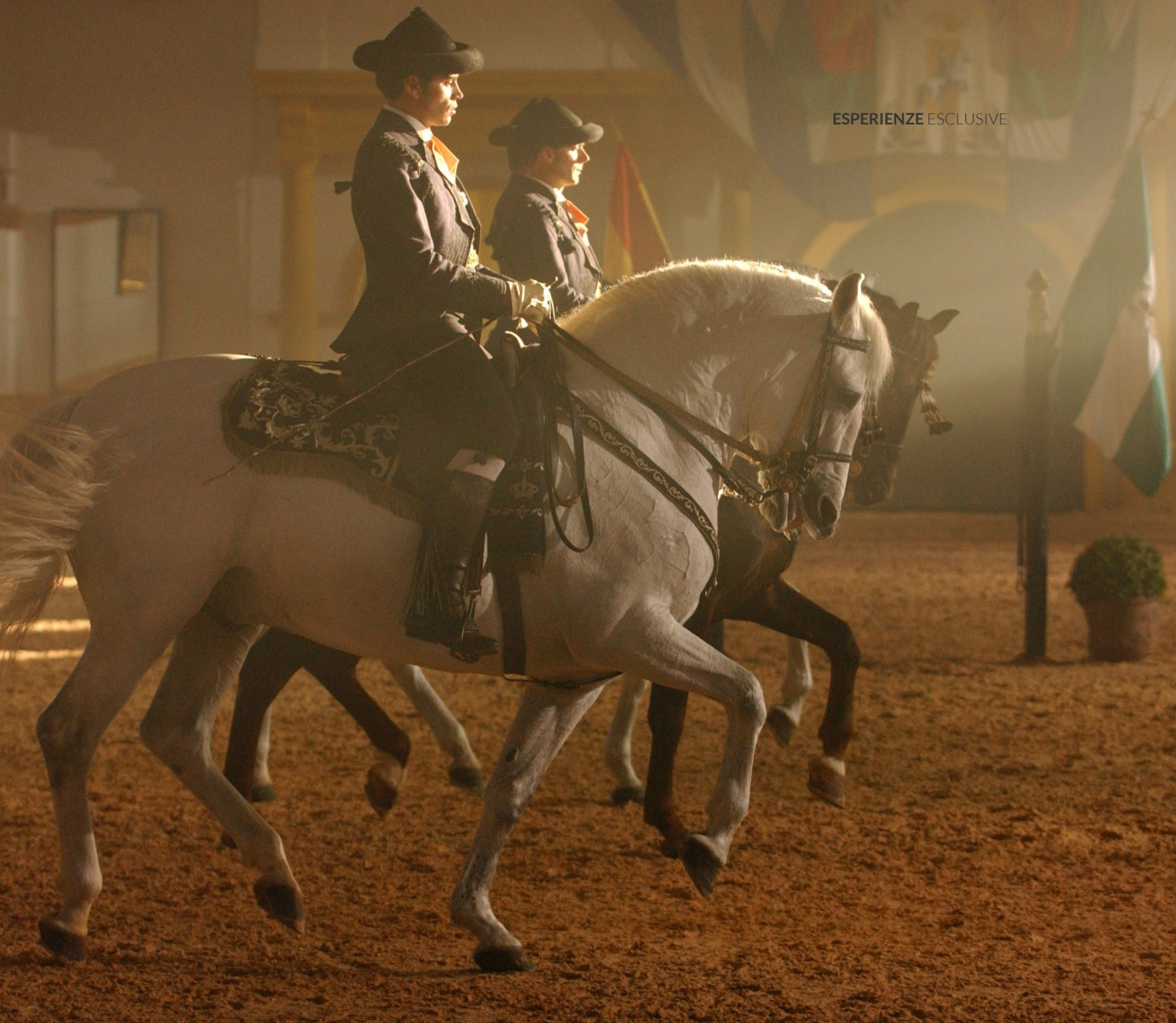
▲ REGIA SCUOLA ANDALUSA DI ARTE EQUESTRE JEREZ DE LA FRONTERA