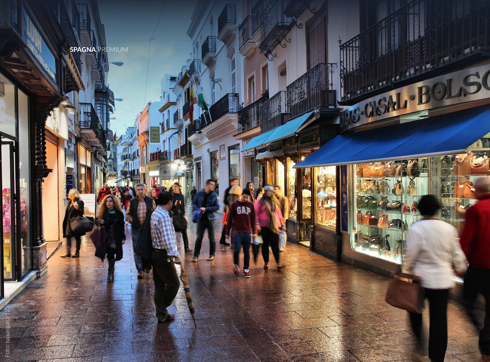
▲ CALLE SIERPES SIVIGLIA