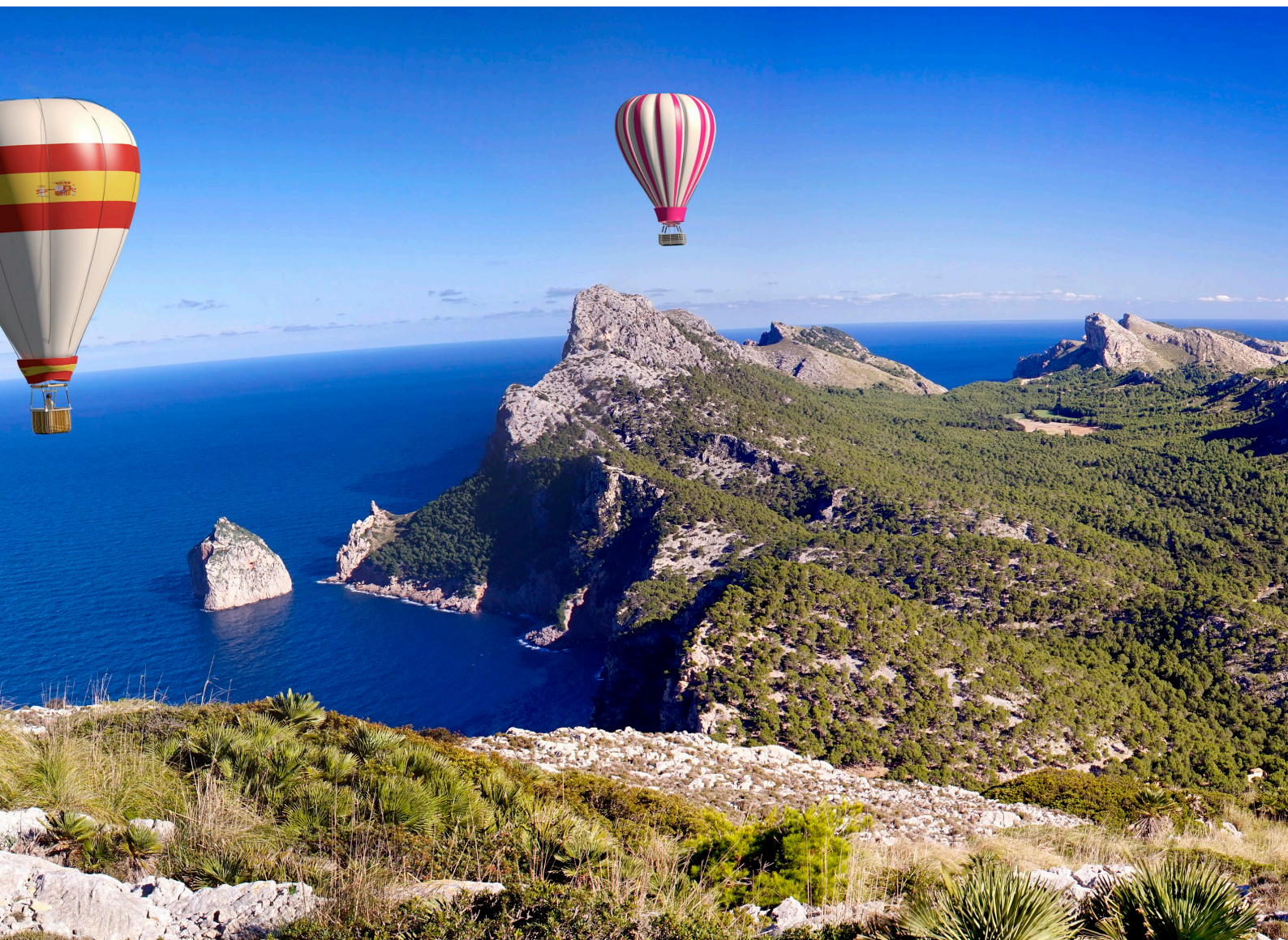
▲ MONGOLFIERE SU MAIORCA