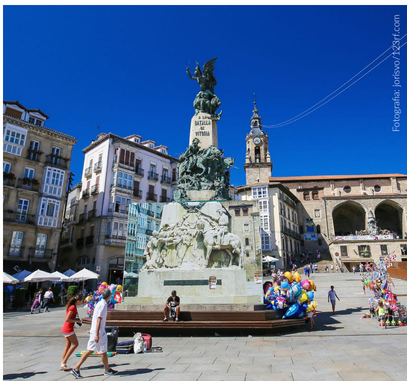
▼ PRAÇA DE VIRGEN BLANCA VITORIA