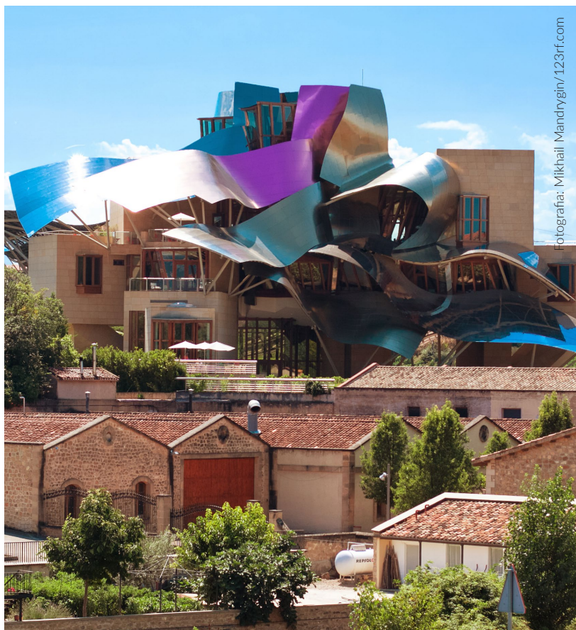
▲ ADEGA DO MARQUÊS DE RISCAL ELCIEGO, ÁLAVA