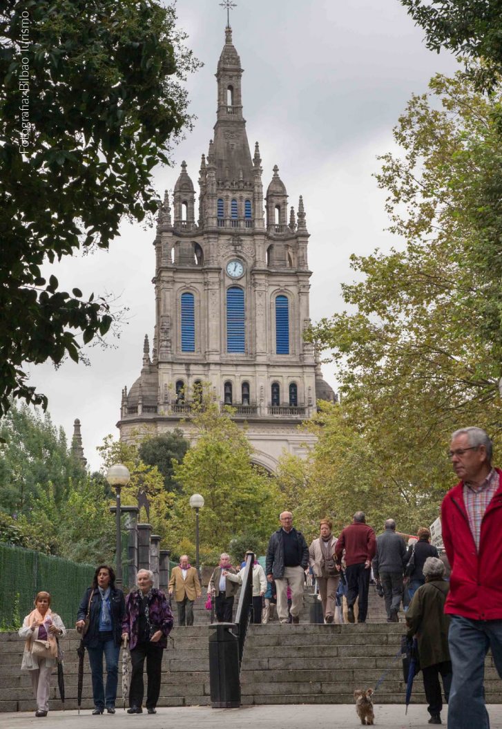
▲ BASÍLICA DE BEGOÑA

Unamuno partem umas escadas com muita história, chamadas Calçadas de Mallona , que unem o Casco Viejo ao belíssimo templo gótico.