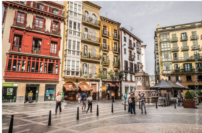
▲ CASCO VIEJO

Poderás passear por ruas largas em forma de quadrícula, que se unem em lugares como a praça Circular. Aqui encontra-se o monumental edifício da Sociedade Bilbaína , uma construção de aspeto eclético com um requintado acabamento interior de estilo inglês e sede do clube mais seleta e exclusivo