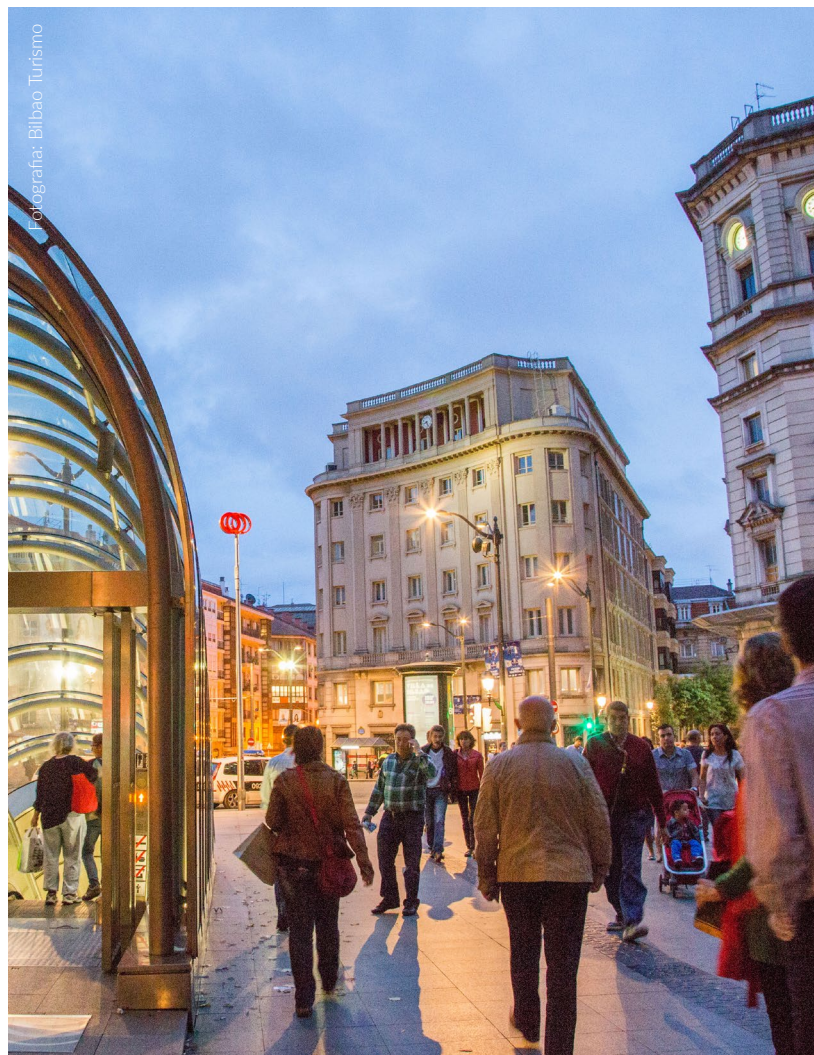
▼ PRAÇA CIRCULAR